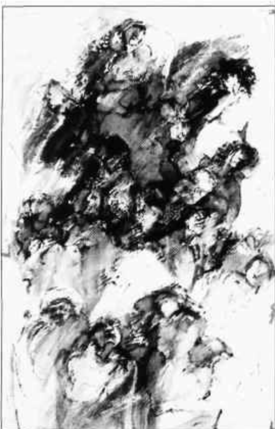
Takács Zoltán • Csodára várók

ányt a kaposvári Iparművészeti Szakközépiskolában tanító, Budapestről vagy Pécsről bejáró fiatal óraadó művésztanárok sem tudják betölteni.)