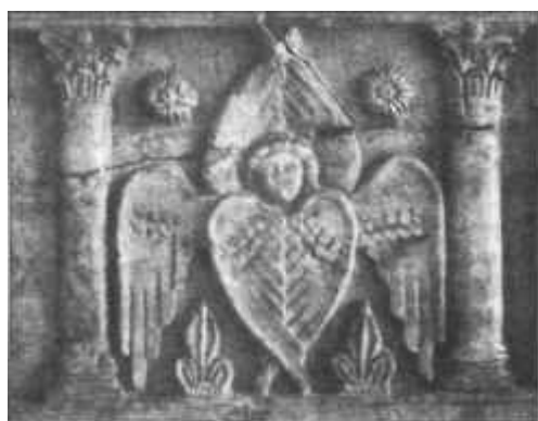
Szent István koporsójának részlete

"Szent István lelke a magyar öntudat, a krisztusi hit, a nyugati szellem felbonthatatlan szintézise, kultúrája a magyar hagyomány, a katolikus vallás, a keresztény erkölcsön és klasszikus szellemben épült európai műveltség elemei harmonikus egységbe foglaló keresztény magyar műveltség volt. (...) Működését a krisztusi igazságba és a magyar jövőbe vetett rendületlen hit és bizalom, a keresztény erkölcsi eszmények és szellemi értékek meggyőződéssel tisztelése hatották át."/12)