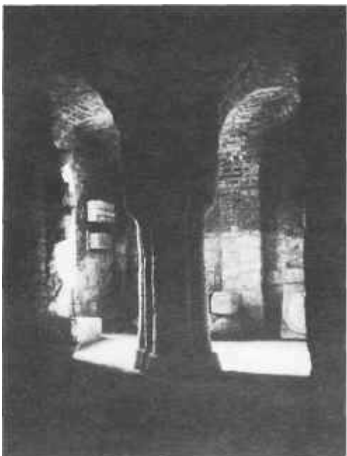
A feldebrői altemplom

rint ő elég nagy úr ahhoz, hogy két istene is legyen, egyes értelmezők nem a keresztény és pogány istenre vonatkoztatták, hanem arra, hogy ő a bizánci és római kereszténységet is magáénak tarthatja. A tizenöt éves fiatalembert jelöli utódjának Géza fejedelem. "István fiára súlyos örökségei hagyott, de éppen az ő kiválasztásában mutatta meg utóljára messzetelektől éleslátását és nem utolsó sorban erélyét. Volt ereje, hogy egy ősi pogány elvvel, a származása (legitimitás) elvével leszámojjon s az utód megjelölésében tiszta keresztény elvet érvényesítsen: az alkalmasság (idoneitás) elvét. (...) Azzal a nyugodt tudattal halhatott meg (997), hogy népének zöme a hűségesköt híven megtartja s a kiválasztott utód a megoldandó súlyos problémákat valóban meg is fogja oldani." (2)