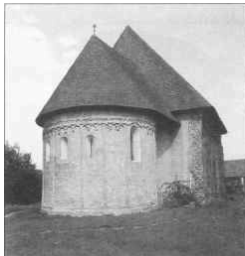
A korcsai templom

"Szent István oktatói, népe térítői nem a németek, nem az olaszok, nem a görögök, nem a szlovének voltak. Lelkét a X. század végén Európa szerte diadalmasan előretörő egyetemes keresztény gondolat hódította meg. Népét a nemzetek fölött álló egyetemes egyház eszméjének különböző népekből sarjadt, de a nemzetiségi különbséget nem ismerő egyetemes kereszténységhez tartozó harcossal térítették. A térítést és egyházszervezést irányító szellem minden gyökérszállával messihi nyugatra és délre - Franciaország és Itália kolostoraiba - nyúl vissza"(8) - írja Hóman Bálint.