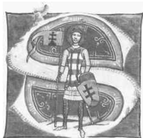
Szent István király hadi díszben (Képes Krónika)

Szent István születési évét illetően vita van a történészek között. 967, 969, sőt 975 évszámok szerepeinek legtöbbször. Apja Géza fejedelem, (aki a keresztységben valószínűleg szintén az István nevet kapta), anyja Sarolta bizánci rítus szerint keresztelkedett. Szüleinek keresztény meggyőződéséről nem sok adatunk van. Géza fejedelemnek azt a kijelentését, misze-