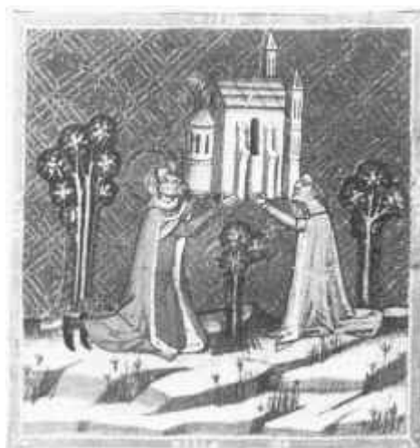
A templomalapító királyi pár (Képes Krónika)