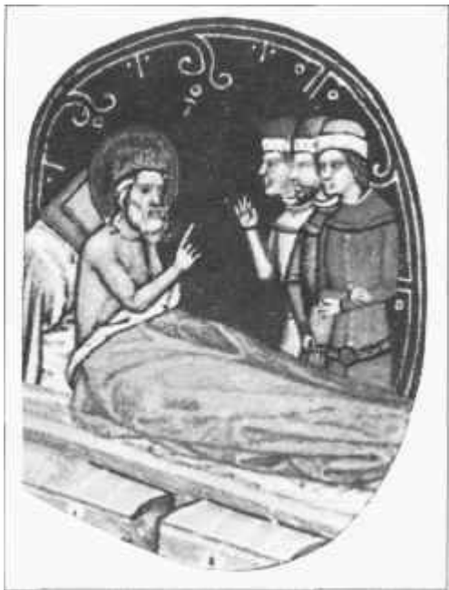
István király betegágyán (Képes Krónika)

Szent István a legfontosabb törvényeket a nyugati nagy törvénygyűjteményekből és a zsinati határozatok tárából merítette. Szigorú, kemény törvényei a kor szigorú törvényhozását követik. Györffy György úgy látja, hogy Szent István törvényei mégis humanusabbak voltak azoknál. Továbbá /ha Magyarország gazdasági és kulturális fejlettség tekintetében nem tudta is felvenni a versenyt a nagy múltú európai országokkal, jogbiztonság tekintetében az élre került a középkori Európában."/9)