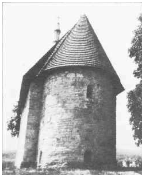
A tarnaszentmáriai István-kori egyház