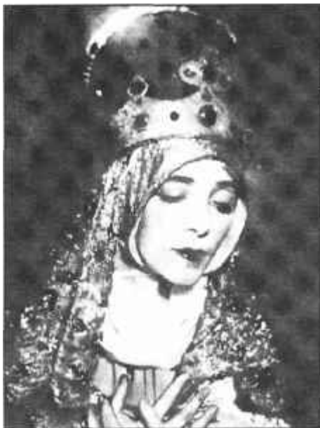
Szűz Mária • Cs. Aczél Ilona

Időközben a Fogadalmi templom építése befejeződik és 1930. október huszonegyedikén sor kerül a templom felszentelésére.