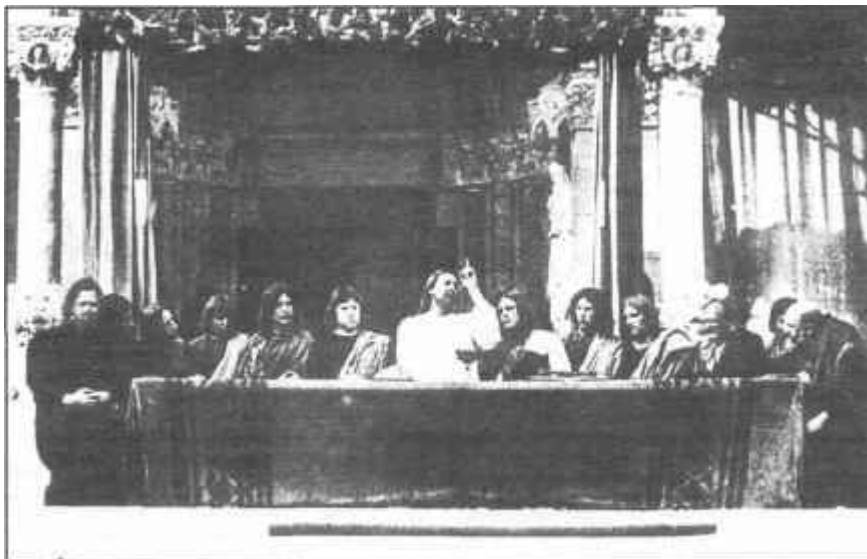
Az utolsó vacsora színpadképe

Hatvanöt éve már az első szabadteri rendezésnek és a Szegedi Szabadteri Játékok a virágkorát éri. Ideje lenne, hogy a játékteret körülölelő Pantheonban helyet kapjon az úttörő előadást létrehozó, nagy magyar rendező, Hevesi Sándor szobra is!