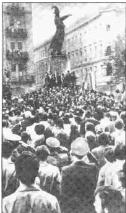
Budapest / Tüntetés a Bem szobornál

Ebben az időben a MÁVAUT munkásai traktorokkal és gépkocsikkal különböző jelszavakat kiabálva felvonultak az Akadémia elé, ahol egy lázongó népgyűlés kezdett kialakulni. Követelték, hogy a helyőrség parancsnoka menjen ki az Akadémiára és adjon választ, hogy miért volt erre szükség. A parancsnoknál lévő fegyvernemi főnökök nem javasolták, hogy a pa-