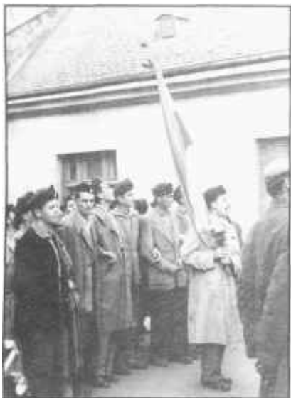
Gimnazisták tüntetése Nagykanizsán

Tátrai Gyula őrgy.sk. ho.pk.pol.h. Zsiros Balázs őrgy.sk.ho.TÜF. Lonszki János őrgy.sk.ho.TÖRF. Bránát István szds.sk.ROV. dr. Gyüszü Miklós szds.sk.ho.vez.o. Sziki Gyula szds.sk.HIF.h.