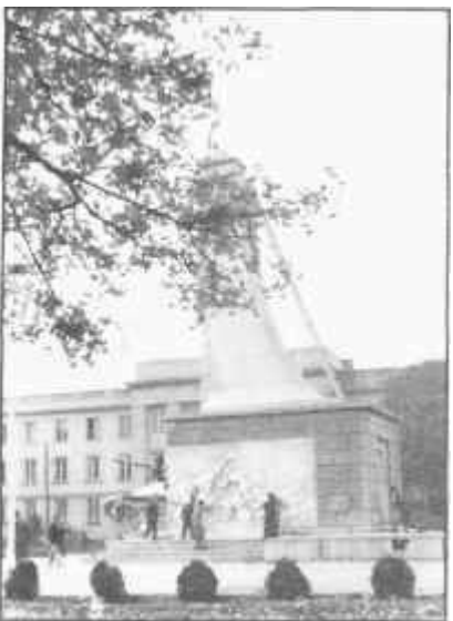
A szovjet emlékmű ledöntése