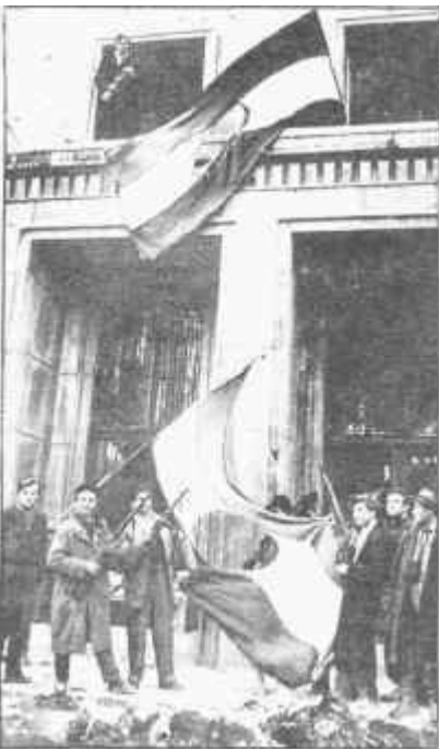
Budapest / A pórtház előtt

Ezen a napon a Katonai Forradalmi Tanács távmondatot küldött az alárendelt felé, hogy biztosítsák a fegyelmet és kövessék a kormányt. Előző napon több alakulat parancsnoka utasítást kért arra vonatkozólag, hogy mi legyen az elhárító tisztekkel és az államvédelmi szervekkel. Rác alez. a 32.löv.e. parancsnoka jelentette, hogy elhatározása, hogy a lengyeltóti olajmezőn szolgálatot teljesítő államvédelmi tiszteket leváltja és beviszi a laktanyába, az ottlévő sorkatonák fegyvernemi jelzését lövész jelzéssel váltja fel. Ezzel az elhatározásával egyetértettek az olajme-