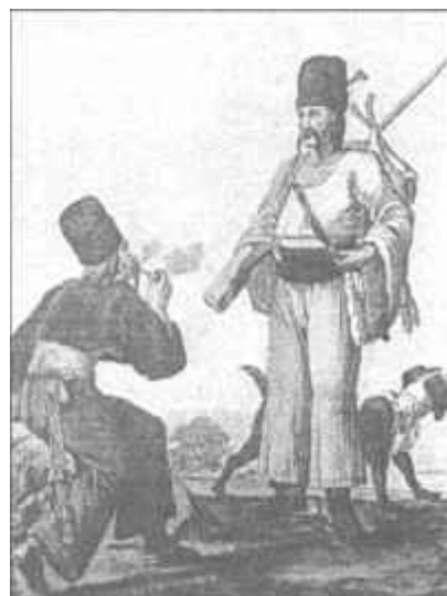
Bocskoros nemesek (Bikkessy-Heinbucher J. rajza nyomán, 1816)

ezen tanú, leveleire, donációjára nem figyelmeztet”. A „diáktalan” kifejezés itt természetesen nem a latinban való járatlanságot jelzi, hanem egyértelműen a tanú analfabéta voltára utal.