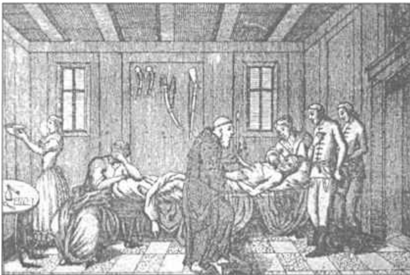
Középnemesi lakás (1796)