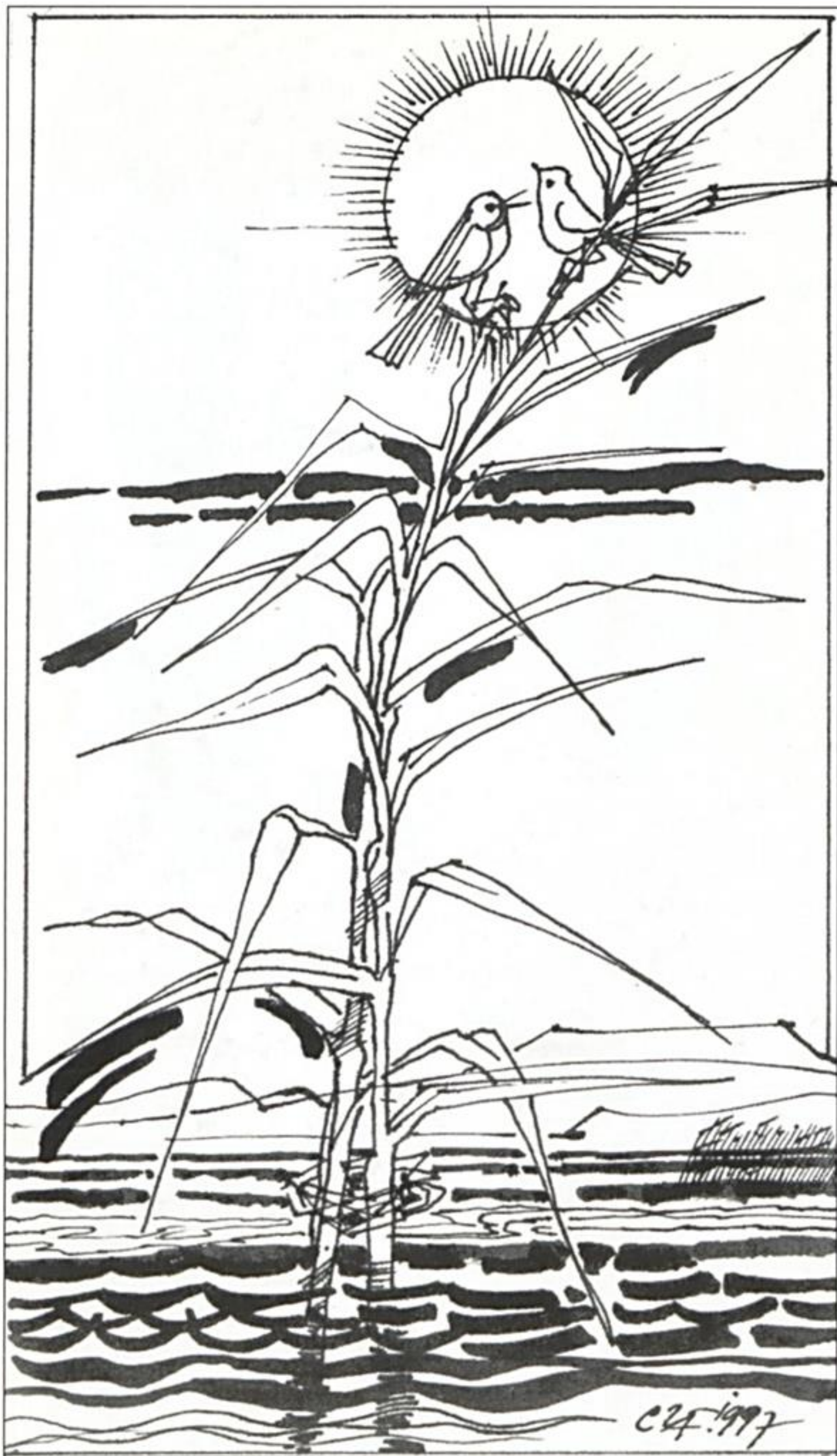
Czinke Ferenc: Illusztráció A szív szonettjei című kötethez