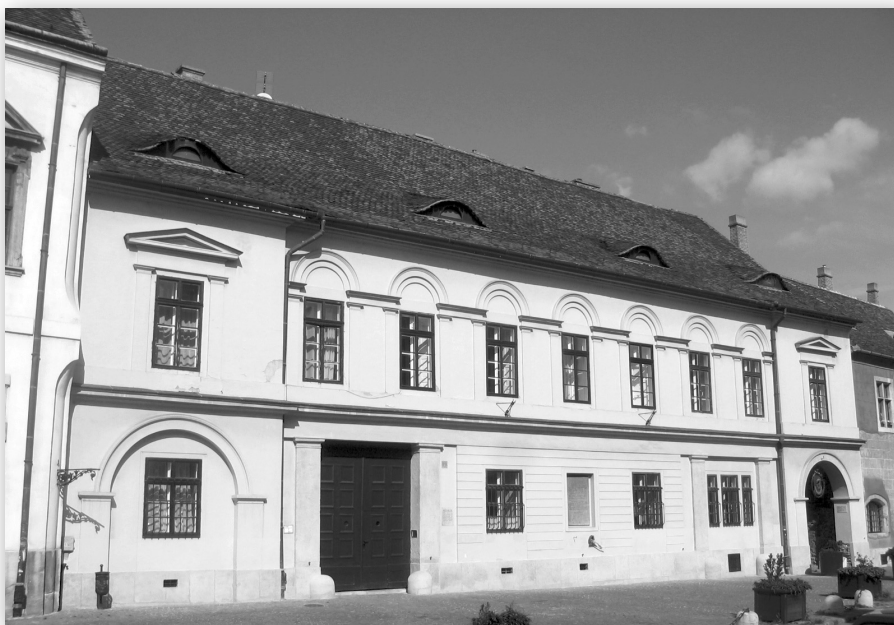
Úri utca 19. – Eötvös József szülőháza

Az életrajzi, kulturális vagy irodalmi lexikonok és kézikönyvek alapján úgy tűnhet, tudott tény: hogy Eötvös József 1813. szeptember 3-án Budán született. Minthogy abban az időben általában otthon születtek az anyák, az író-politikus születése helyével látszólag nem merül fel probléma: ez az otthon elvileg az apa, ifjabb Eötvös Ignác főtárnokmester várbeli házáat jelenti. Az épületet a műemléki szakirodalom, illetve útikönyvek révén pontosan be lehet azonosítani: a Szűk utca, majd Balta köz és az Olasz, majd Herrengasse, illetve Úri utca sarkán álló ház – jelenleg Úri utca 19. Ám ezekkel az adatokkal, és így természetesen a fényképekkel is, amelyek Eötvös szülőházát hivatottak ábrázolni, valójában nem olyan gondtalan a helyzet, mint ahogy azt a látszat sugallja.