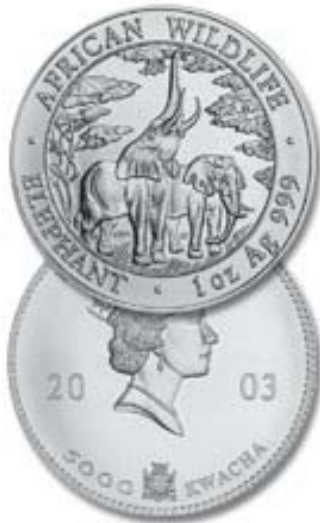
Elefánt, 5000 kwacha, 1 uncia színezüst, Zambia, 2003