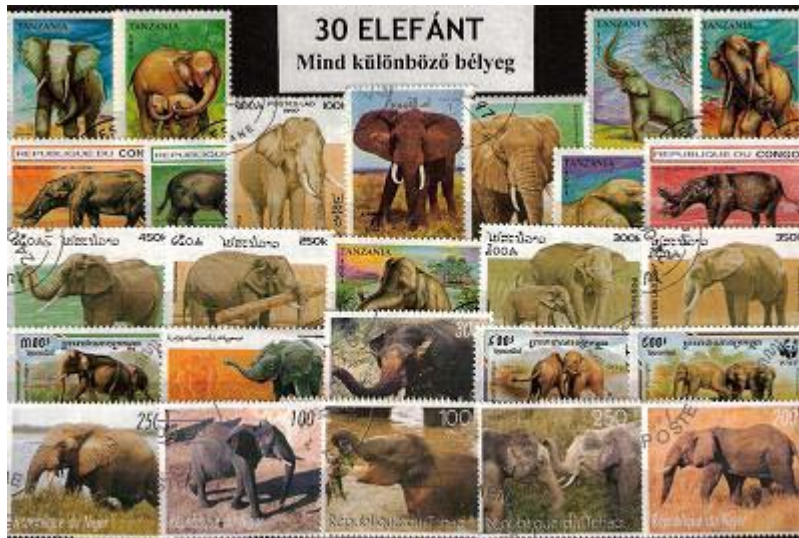
Különböző területek elefántjait ábrázoló bélyeggyűjtemény