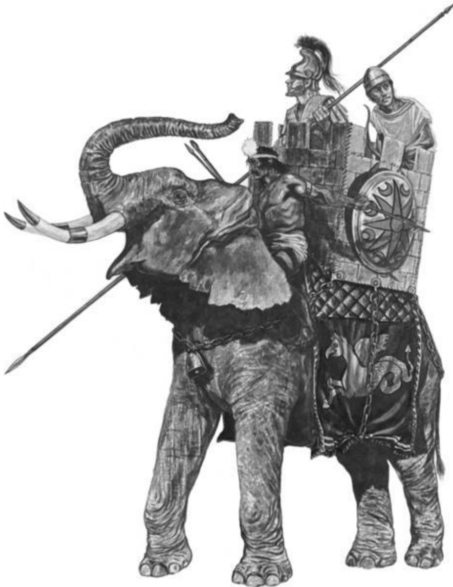
Makedón harci elefánt