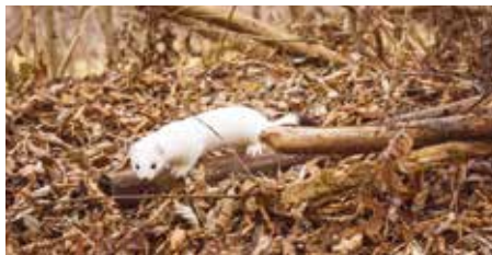
Télen szőre fehérre vált, ami a rejtőzködést szolgálja

A menyétfélék valaha fontos szerepet töltek be kontinensünkön, hiszen szelídített példányaik kiváló rágcسالóirtók voltak a ház körül. A kifejezetten emberkerülő hermelin a hazai menyétfélék ritka faja. Elterjedési területe hatalmas: Euráziában, Észak-Amerikában, a tundrán és a mérsékeltövi erdőségekben is viszonylag gyakori. Hazánk egész területén előfordul, de közel sem azonos állománysűrűségben. Óriási elterjedési területén 19 alfajt tartanak számon, különböző testmérettel.