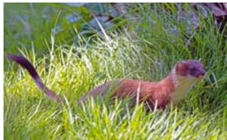
Tavasztól őszig vörösesbarna ruhát visel

A nálunk előforduló egyedek testhossza 25-30 cm, farkuk 10-14 cm, tömegük 15-40 dekagramm. A hímek lényegesen nagyobbak a nőstényeknél.