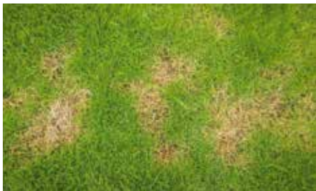
A túllocsolás miatt kialakulhatnak gombás foltok a gyepten

Szeretnék még pár tanácsot adni, amivel könnyebb és eredményesebb lesz a gyepterápia, és így még zöldebb lesz a kertünk. Hiszen a zöld gyepterápia, a kedvező klimatikus hatása a család apraja nagyja számára csodálatos környezetet nyújt. Arra készüdjünk fel, hogy egy szép zöld, ápolt gyepterápia rengeteg munkát, törődést, anyagi ráfordítást és nagyon sok öntözővizet igényel. A tervezésnél figyeljünk oda, hogy ne csak fű legyen a kertben, hanem lomblevelű örökzöldek, virágzó cserjék, és ha lehet, virágzó évelők is, így természetes és nem művi környezetben lesz a házunk vagy a nyaralónk.