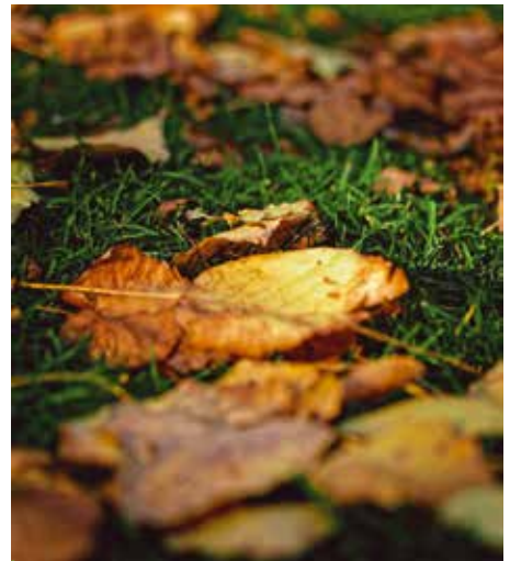
Lombfűvóval távolítsuk el a friss fűvetésről a lehullott leveleket

Ezért fontos a jó minőségű és szerkezetű talaj előkészítése. Ha már kicsírázott a fűmag, a napi 2-3 öntözést visszavehetjük egyre. Ha a fűszálak már akkorára megnöttek, hogy a végük vissza-