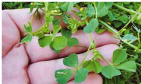
Őszi vetés után a következő évben már használhatunk speciális gyepterápia-ellenes szerkeztet

Az öntözés is nagy felelősség, még egy kiépített automata locsolórendszer is okozhat galibát, ha rosszul állítjuk be.