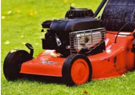
Lehetőleg gyűjtőtartályos fűnyírót használjunk az első nyírások alkalmával

Fontos a pontosan, egyenletesen kiszórt, jó minőségű fűmag. Egy négyzetméterre 4-5 dkg a szükséges mennyiség, persze nagyon egyenle-