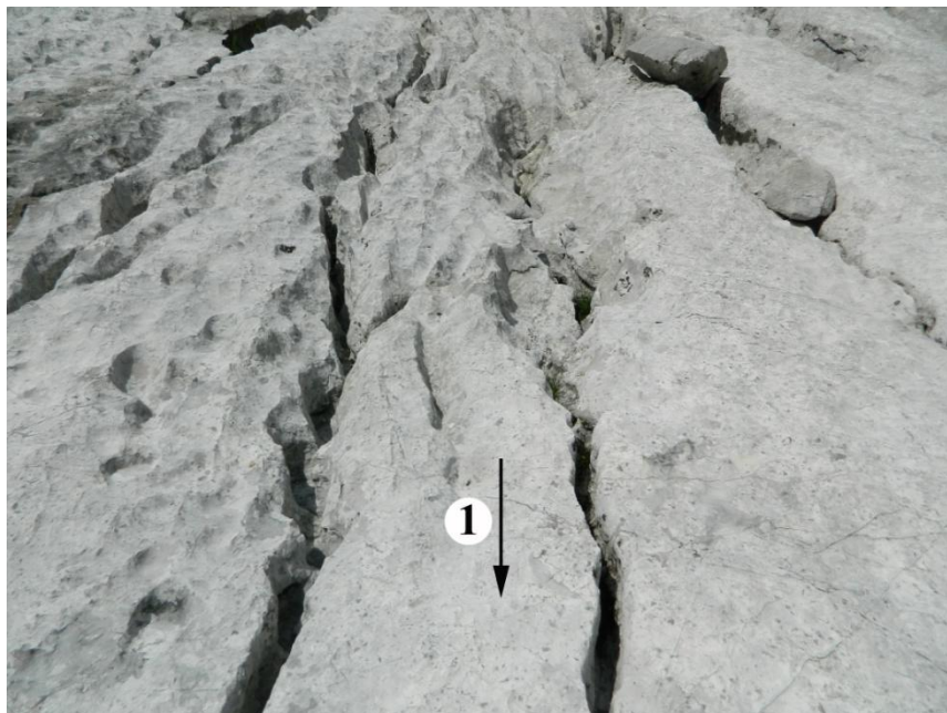
1. ábra: Alul keskeny fővályúk Jelmagyarázat: 1. a lejtő dőlésiránya Fig.1 Main channels which are narrow on their lower part Legend: 1. dip direction of the slope

vályú talpa a csatlakozásnál a fővályú talpa felett több cm-rel, vagy több dm-rel magasabban végződik el, tehát a becsatlakozásoknál lépcsőt alkotnak. A nem függő mellékvályú talpa a fővályú talpának a szintjében húzódik. A nem függő mellékvályút kialakító vízág (mellékvízág) és a fővályút kialakító vízág (fővízág) kialakulásának kezdete egyidejű. A nem függő mellékvályú később nem alakulhattak ki, mert ekkor a fővályúhoz képest mélyülésüknek gyorsabban kellett volna történnie. A függő mellékvályú vízágai viszont a fővályú vízágánál később képződtek, vagy egyidejű a kialakulási koruk, de a mellékvályú mélyülése elmarad a fővályú mélyüléséhez képest. Erre azon mellékvályúknál van esély, amelyek vízgyűjtője sokkal kisebb, mint a fővályúé. Vagyis, amíg a nem függő mellékvályú mindig egyidősek a fővályú kialakulásának a kezdetével, addig a függő mellékvályú lehetnek egyidősek (ha nagyon kicsi a vízgyűjtőjük), vagy fiatalabbak is, mint a fővályú.