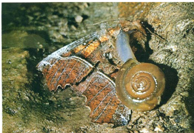
4. kép: A pihenő vörös csipkésbaglyot ( Scoliopteryx libatrix ) egy korongcsiga ( Oxychilus sp.) támadja meg Picture 4: A Glass Snail ( Oxychilus sp.) attacks the resting Herald Moth ( Scoliopteryx libatrix )

A pihenő, vagy áttelelő lepkék a barlangokban sincsenek teljes biztonságban a fogyasztóikkal szemben. A lelassult életműködésű lepkék egy része főként a falakon biztonsággal közlekedő pókok és csigák áldozata lesz (4. kép).