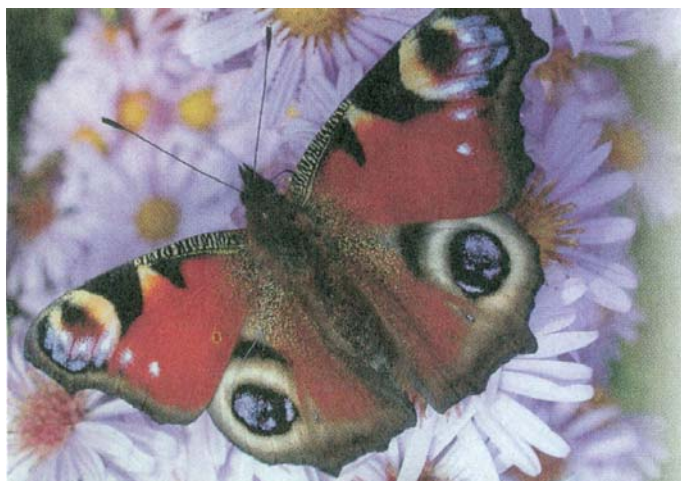
3. kép: Nappali pávaszem ( Inachis io ) a szabadban Picture 3: European Peacock ( Inachis io ) afield

rült. A Triphosa haesitata észak-amerikai barlangokban fordul elő ( GINET – DEGOU 1977, LENGERSDORF 1957 ).