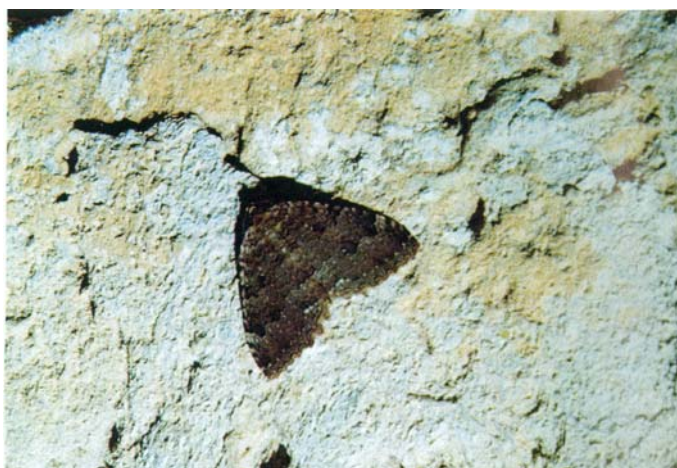
1. kép: Kutyabenge-araszoló ( Triphosa dubitata ) a barlang falán Picture 1 :A Tissue ( Triphosa dubitata ) on the cave wall

Ez a lepke az araszolók ( Geometridae ) családjába tartozó nem ritka faj (MÓCZÁR 1969). A kifejlett állatok 20-23 mm nagyságúak (1. kép). Testük, szárnyuk selymes, halványbarna, vagy szürke, a szárnyak mintázatát csak árnyalatnyi színeltérésű hullámvonalak adják. Az első szárny szegélye erősen hullámos. Pihenés közben hátsó szárnyukat a háromszög formában kitehített első szárnyak alatt tartják. Szívesen keresik fel a barlangokat mind a napközi pihenésre, mind áttelelésre (BOUVET és munkatársai 1974). Előfordulásuk néhány esetben tömeges. A hernyóknak csak 2 pár ún. hernyólába van, ezért kénytelenek araszolni. Tipikus tápnövénye a kutyabenge ( Frangula alnus Mill.) Ez egy 2-3 méterre megnövő cserjefaj, melynek levelei ép szélűek, virágai zöldes fehérek és öttagúak (POLUNIN 1981), termései borsó nagyságúak, előbb pirosak, majd lilásfeketék. Liget – és láperdők, mészkerülő erdők faja.