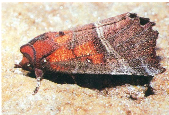
2. kép: A telelő vörös csipkésbagoly ( Scoliopteryx libatrix ) testén lecsapódó vízcseppek vannak Picture 2: Precipitated waterdrops on the body of a wintering Herald Moth ( Scoliopteryx libatrix )

vok) vannak. Pihenés közben szárnyaikat háztetőszerűen tartják. A kifejlett lepkék a nyári napokban is pihennek a barlangok falán, de a barlangokban (pincékben) való telelés az általános. Hernyói csupaszok, a talajban laza kokont szőve bábozódnak. A hernyók csak a fűzfafélék ( Salicaceae ) leveleit eszik. Kedvelt gazdanövényük a kecskefűz ( Salix caprea ) és a rezgő nyár ( Populus tremula ), mely növények kizárólag csak mészsímentes talajokon élnek.