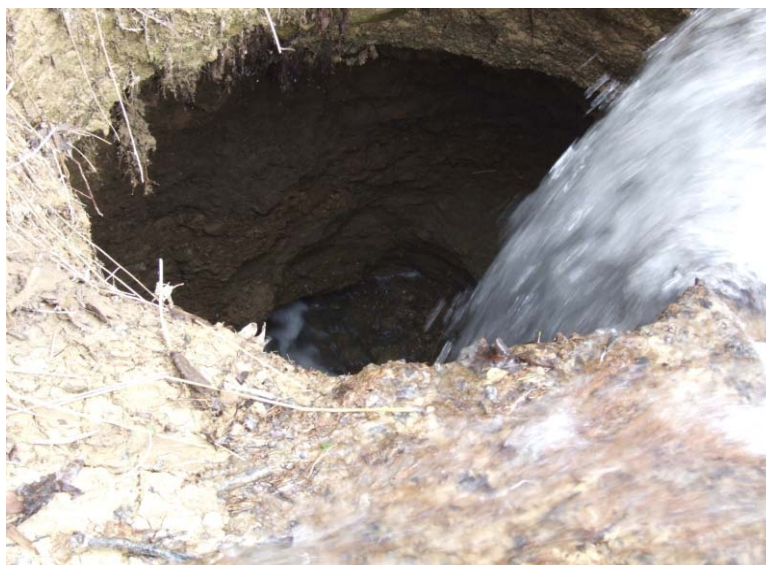
1. kép. A feltároló víznyelő ürege Picture 1. Chamber of the developing sinkhole

2009-ben a Bervai Vízmű karsztaknájától nem messze, közvetlenül a meder mellett kialakított beásásban keletkezett az az 1-1,5 m átmérőjű nyílás, amely a nyílásnál kettéágazó patak vizét belevezette a fedett karsztba. A felnyílás szája alatt harangszerűen kiszélesedő üreg alakult ki, melynek mélysége 2,5-3,0 m, talpi szélessége 3,0-3,5 m volt. A feltárt rétegsor legfelül mintegy 20 cm-es humuszos talajból, alatta kb. 1,3-1,8 m vastag agyagból, azt követően durva, agyagos homok és kavics üledékből állt. Az üreg alján rés jellegű vízvezető járatban tűnt el a patak tavaszi nagy vízhozamának kb. 80%-a (50-60 l/másodperc) és ömlött be a karsztba. Minden bizonnyal egy újabb agyagos, vízzáró réteg, vagy lencse alkotta az üreg alját, hiszen a bezúduló víz - jól láthatóan irányt változtatva - közel vízszintes járaton tűnt el. A patak vizének kb. 20 %-a a mederben tovább folyt. A víz áramlásának irányát az üregben látható jelek és folyamatok alapján, meglepő módon, ÉK-inek, a Berva-bérc felé tartónak lehetett feltételezni. Ez pontosan a Vízmű karsztaknája felé mutatott (1. kép).