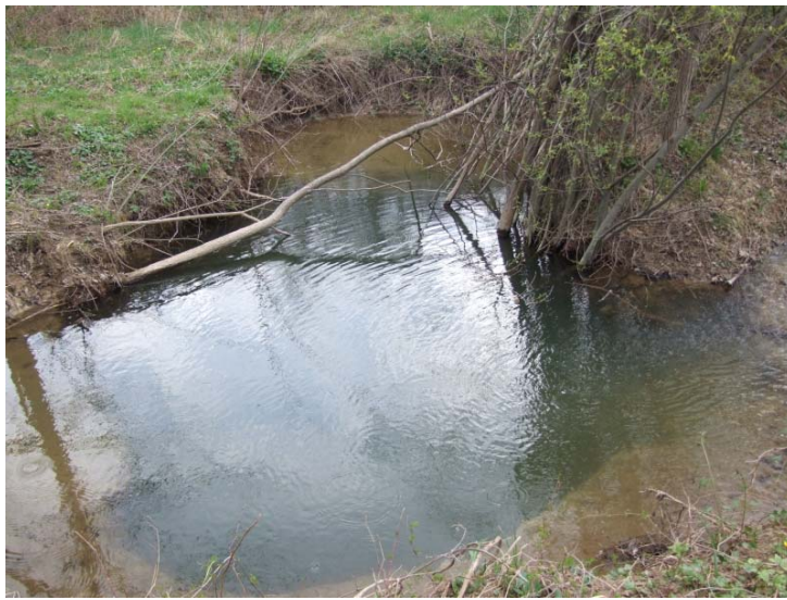
2. kép. A víznyelő állapota 2010 áprilisában Picture 2. The current stage of the sinkhole (April 2010)

újráműködésének lehetőségét. Sajnálatos módon a nem kellően végiggondolt mentesítő beavatkozás csak ideig-óráig nyújtott védelmet. 2010 januárjában a hirtelen bekövetkezett enyhülés hatására meginduló intenzív olvadás miatt a Berva-patak váratlanul megduzzadt és a víz újra elérte az el nem tömedékelt nyelő nyílást. Ezt az állapotot csak szemtanúk leírásából ismerjük, akkor sajnos senki nem jelezte felénk a víznyelő működését. Ez év március közepén kaptunk hírt a víznyelőről, de a helyszínen ekkor már csak a következőket lehetett megállapítani: