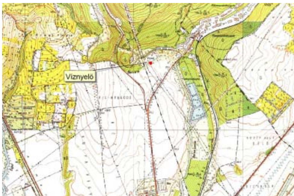
1. ábra. A tárgyalt víznyelő helyzete M1:10 000 térképen jelölve Fig. 1. A map showing the position of the studied sinkhole (scale: 1:10 000)

2009 márciusában a bervai lakótelepről érkezett telefonos bejelentés hívta fel a Bükki Nemzeti Park Igazgatóság munkatársainak figyelmét egy rendkívüli természeti képződményre (1. ábra), a Berva-patak mellett újonnan keletkezett víznyelőre. A lakók a Bervai Vízmű ivóvízként használt tiszta karsztvizét féltették az újonnan felnyílt víznyelől át a karsztvízbe kerülő szennyeződéstől. Aggodalmuk nem volt teljesen alaptalan, a patak vize, mely eltűnt a víznyelő mélyén, nem tekinthető szennyeződésmentesnek.