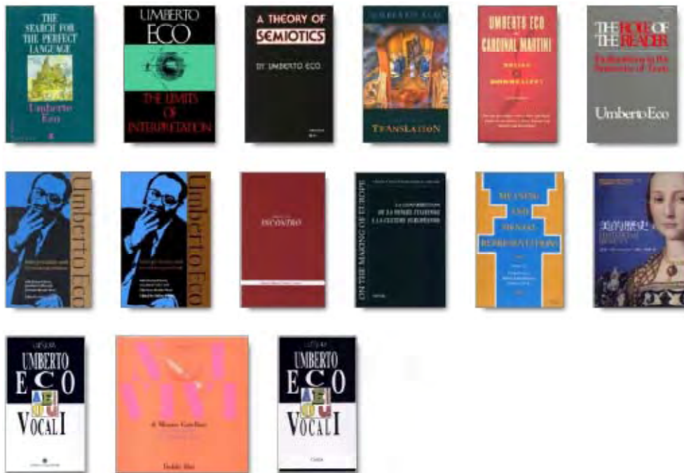
2. ábra: Umberto Eco előnézeti opcióval olvasható kötetei a Google Books-on

A Google Books három szinten ad betekintést a naponta több száz tétellel gazdagodó adatbázisba: a könyvtári katalógus, a korlátozott előnézet és a teljes nézet szintjén. Mind a három hasznos lehet, de tanárnak és diáknak a legizgalmasabb természetesen az, ha a teljes könyv szabadon és ingyenesen olvasható. Ha a kiadó ehhez hozzájárult, akár a teljes szöveg elérhető, illetve PDF-formátumban letölthető, és ami még ennél is zseniálisabb, tartalma online kereshető.