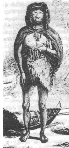
Egy hiányzó láncszem (az expedíció egyik tagjának rajza)

Darwin a vörös szőnyegen beszédet tart a felfedezésről – Beviszik a láncszemeket a székesegyházba, de a püspök nem kereszteli meg őket: