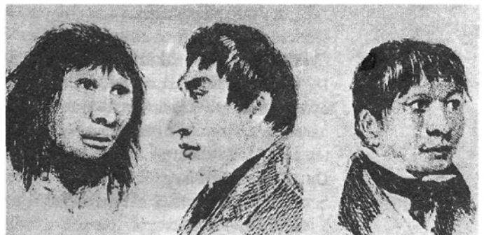
Tűzföldi Kosár, Yorki Székesegyház és Pityke Jimmi (korabeli rajz)