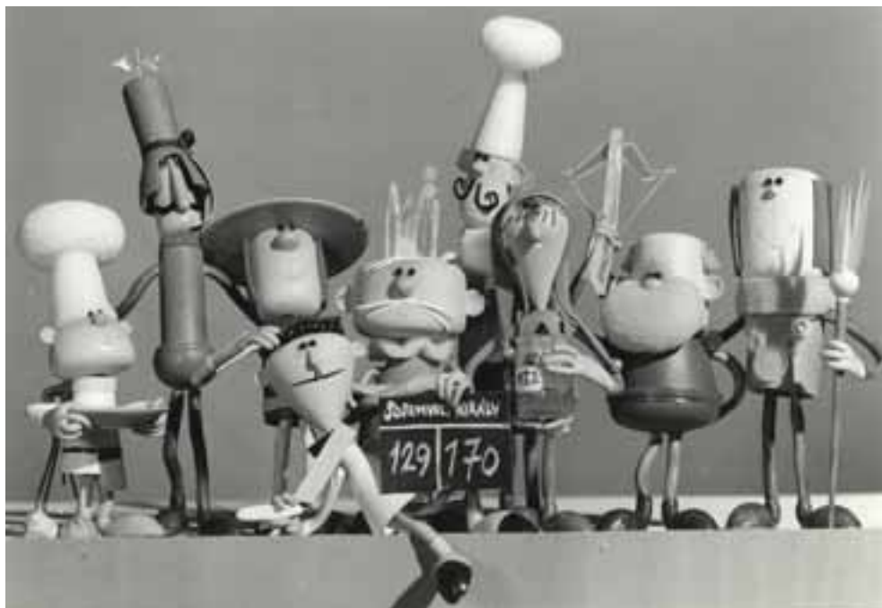
Sosem volt király bánata