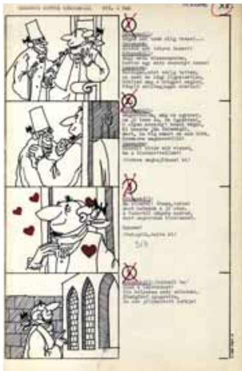
Casanova kontra Kékszakkál, Forgatókönyv-részlet. PIM-OSZMI

össze a tojások, s amikor egyet közülük a háziasszony fölüt, a többi megsirítja. A néző nevet – és zavarban van. [...] Elsősorban a krimi-találás arra emlékeztet, hogy az ember rendszerint csak a csirke lemészárlásától iktózik, a tömegméretű embermészárlás számos embert kevésbé rendít meg. Ez a mélyebb gondolat, amely a film képeihez társulhat; a másik – ehhez képest – felszínesebb, de a keret inkább ezt hangsúlyozza: az ember kulturális élvezeteiben kevésbé válogatós, vagy ha véleményével válogat is, szívesen megeszi mégis a – giccset.” 29