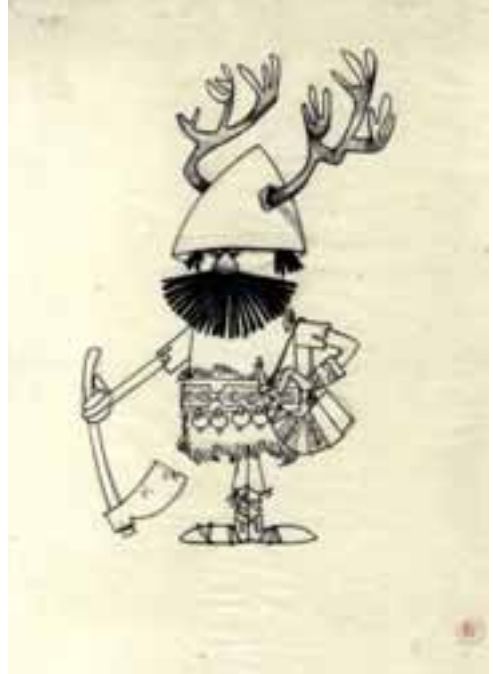
Viking figurák terve. PIM-OSZMI Bábvár

Noé, Vörös Erik, a viking, Kolumbus és sok más. Mindegyikük számára külön hajó épült és természetesen más-más típusú bábuk készültek. 16 A PIM-OSZMI Bábvárban néhány – sajnos egyelőre azonosítatlan – bábtervet is őrzünk Foky Ottótól. Ezek között szerepel egy „kormányos” feliratú, reneszánsz öltözékű alak és két viking harcos, egy idősebb, köpcösebb, és egy fiatalabb, sisakján szarvasagancsokat viselő férfi. A figurák talán ehhez az alkotáshoz készültek. 17