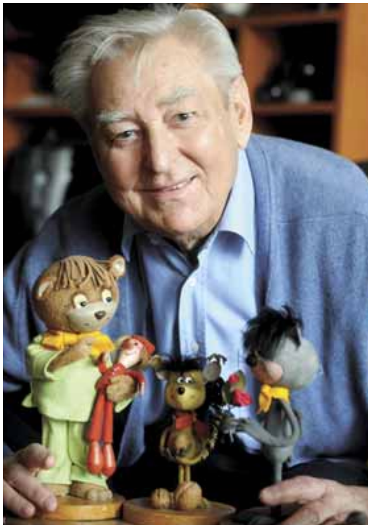
Foky Ottó (1927–2012) kedvenc bábfiguráival

– írta Józsa György Gábor, a Magyar Nemzet filmkritikusa az 1984-es animációs film termését ismertetve. A nyolcvanas évek közepétől megritkulnak a Foky Ottóról szóló hírek. Ennek okát egy 1998-as interjúból tudjuk meg: „A filmszalagnak van egy sajátos illata. Olyan, mint egy csodálatos nő. Nem lehet elfelejteni. Ráadásul hirtelen hagytam abba. – Miért is? – Így kaphattam tisztességes