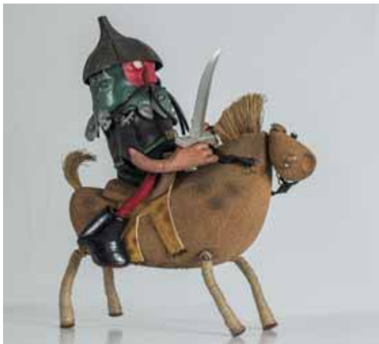
Ősmagyar lovas a Szentgalleri kalandból, 1962. PIM-OSZMI Bábtár, Fotó: Gál Csaba