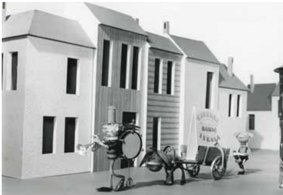
Részlet a Bohóciskola című filmből