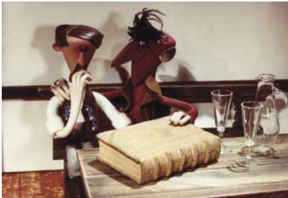
Lóka ördöge

Domanovszky György véleményével értett egyet Révész Zsuzsa is: Foky „megtalálván ezt a kifejezési formát, nem is kíván egyebet, mint hogy műfajában minél tökéletesebben, minél szabadabban, őszintébben fejezhesse ki magát. [...] A kiváló cseh művész, Trínka például a stilizálás hasonló útján indult el, mint kezdetben Foky, s eljutott egy bágyadt naturalizmusig, mely merőben ellentétes a báb szellemével. Foky egyre lényegre törőbb megformálással tartja görbe tükrét a világ elé. A könnyen idomuló műanyagot, mely Trínkát a naturalizmusra csábította, művésznünk a maga nyers, anyagszerű valóságában használja fel: ebben őszintébb, modernebb a neves cseh mesternél. Sokkal kevesebb díszítéssel, sokkal jellemzőbb, összefogottabb ábrázolással készíti figuráit, mint