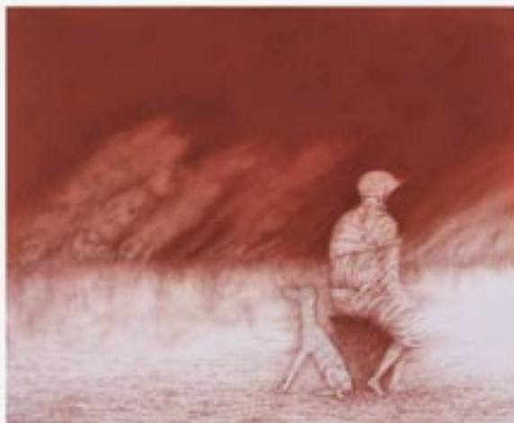
A Komáromi Képtér kiállításának meghívója

A kiállítás megtekintéséért 2007. december 21-ig, a művelődési központ nyitva tartásáig egyúttal.