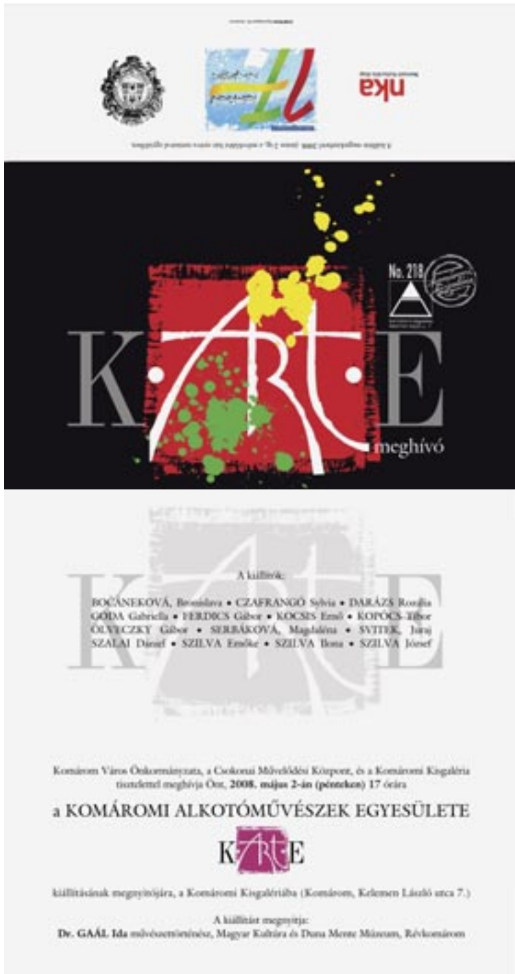
A Komáromi Kiszaléria kiállításának meghívója