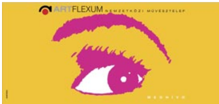
A Komáromi Kisgaléria kiállításának meghívója