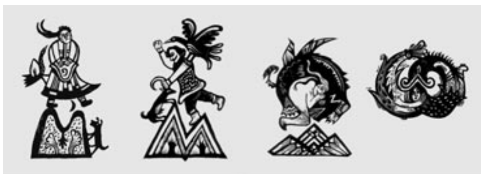
A Komáromi Kiszaléria kiállításának meghívója