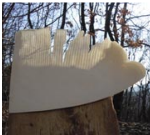
Borza Teréz: Ég és Föld között , 2018. (mintázott rétegtelt porcelán + öreg fa, 35x28x13 cm)