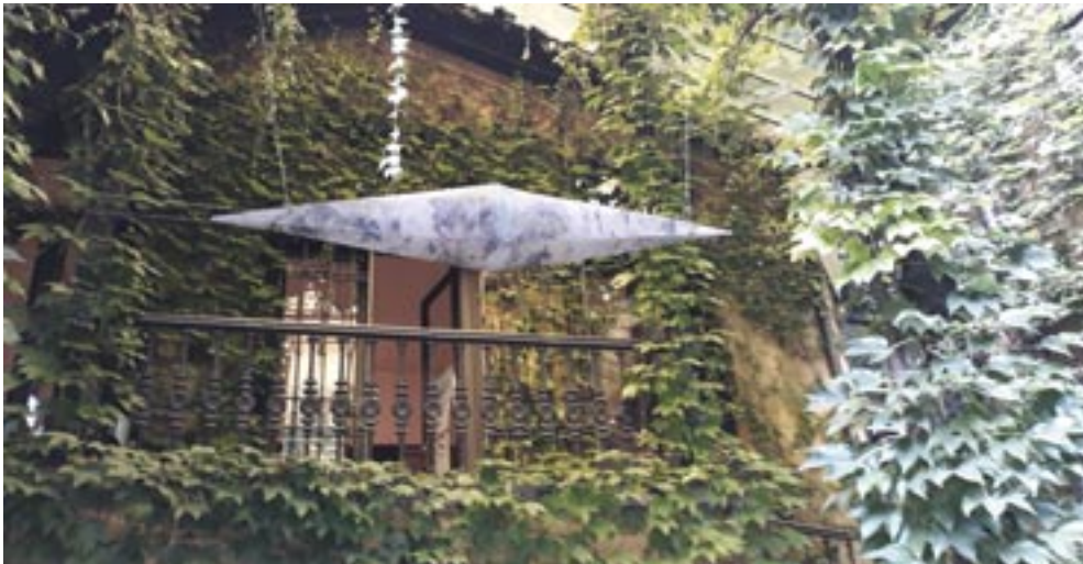
Szűcs Zsuzsanna: Tájoló , 2020. (samott, vegyes technika, 189x37x37 cm) Bp., MÉSZ Székház