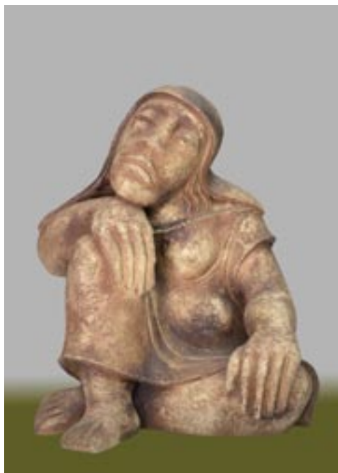
Németh János: Pihenő, kendős asszony , 1990. (samottos, agyagmázás kőcserép, 50 cm)