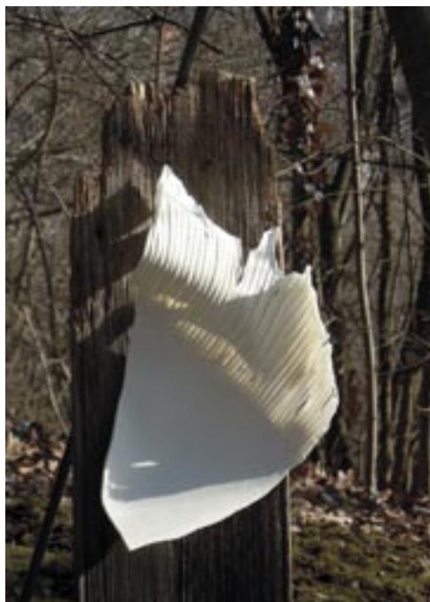
Borza Teréz: Lebegés , 2018. (mintázott rétegtelt porcelán + öreg fa, 30x42x13 cm)