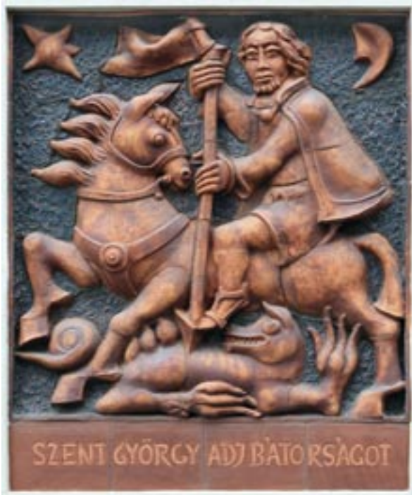
Németh János: Sárkányölő Szent György (samottos, agyagmázás kőcserép, 170x190 cm)

meg, s így oly módon lett eredeti és újító, hogy a legerősebb tradíciókra épített. Míg a korongozással évszázadokon keresztül funkcionális tárgyakat hoztak létre, melyre ő is képes, közben az építészethez, a környezetalakításhoz kapcsolódó műveivel autonóm, a legnemesebb és legigényesebb grand art körébe sorolandó műveket hoz létre.