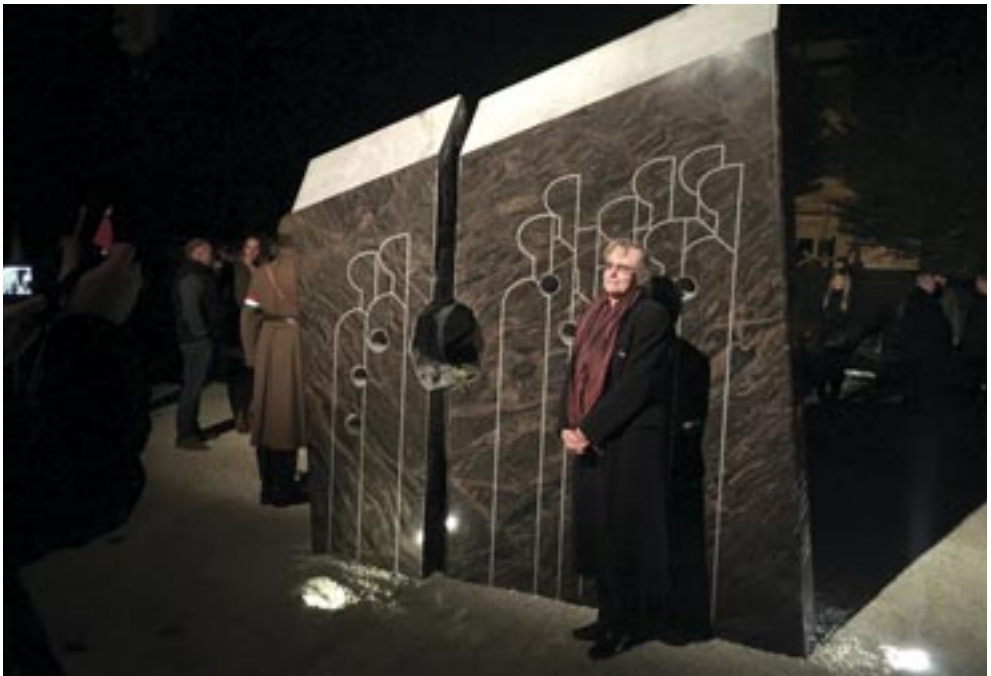
Borza Teréz: „1956 fénye örökké ragyog”, 2016. (indiai gránit, 310x250x42 cm) Sopron, Széchenyi tér.