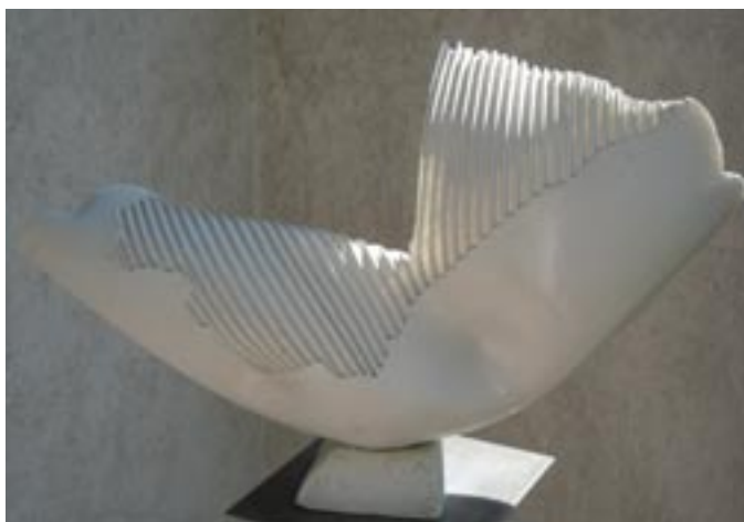
Borza Teréz: Lélekmadár , 2015. (mintázott, rétegelt porcelán 8x42x26 cm)