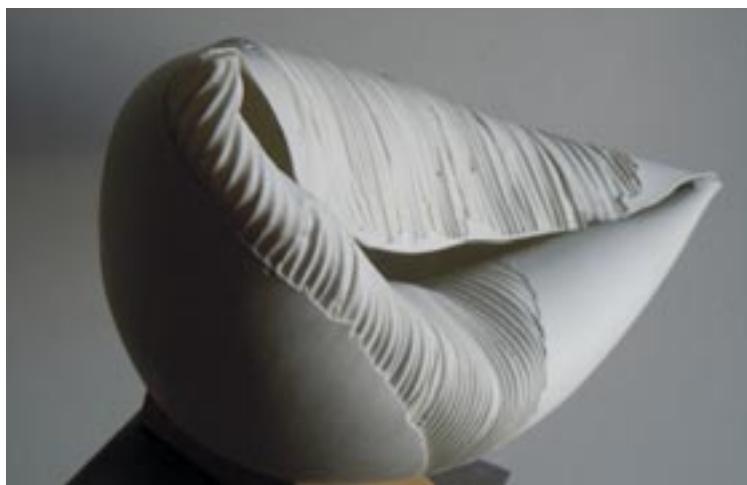
Borza Teréz: Álom , 1996. (mintázott, rétegelt porcelán 48x43x45 cm)