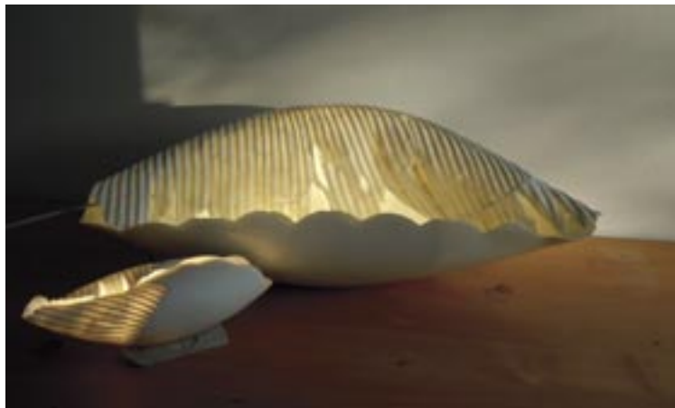
Borza Teréz: Halak párbeszéde , 2019. (mintázott, rétegelt porcelán 48x37x27 és 28x8x8 cm)