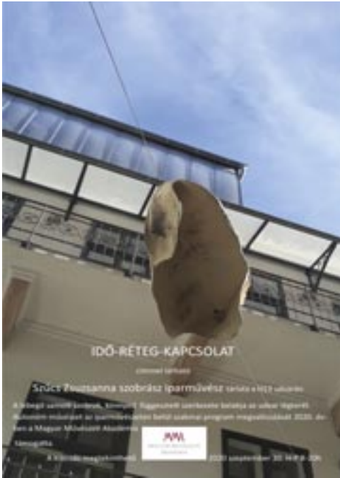
Meghívó-borító: Idő-réteg-kapcsolat , 2020. (samott, vegyes technika, 130x32x38 cm) Bp., Jezsuita udvar