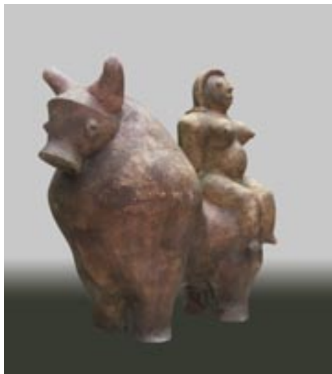
Németh János: Európa elrablása , 1973. (samottos, agyagmázás kőcserép, 70x80 cm)