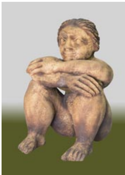
Németh János: Gondolkodó, ülő nő , 1993. (samottos, agyagmázás kőcserép, 55 cm)