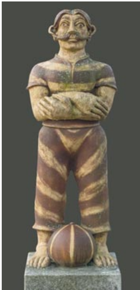
Németh János: Fürdőző II , 1999. (samottos, agyagmázás kőcserép, 140 cm)