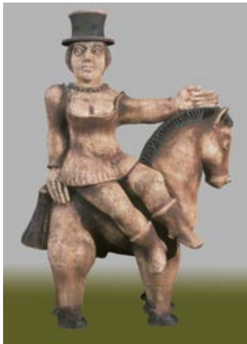
Németh János: Műlovamő , 1993. (samottos, agyagmázás kőcserép, 80x116 cm)