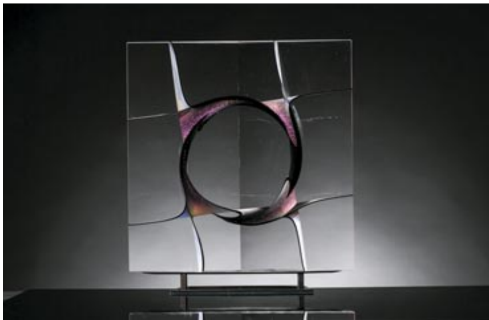
Borkovics Péter: Fekete háló , 2020. (összeolvasztott színes síküveglapok, melegen formázva, csiszolt, polírozott, 49,5 x 49,5 x 4,5 cm) Magántulajdon