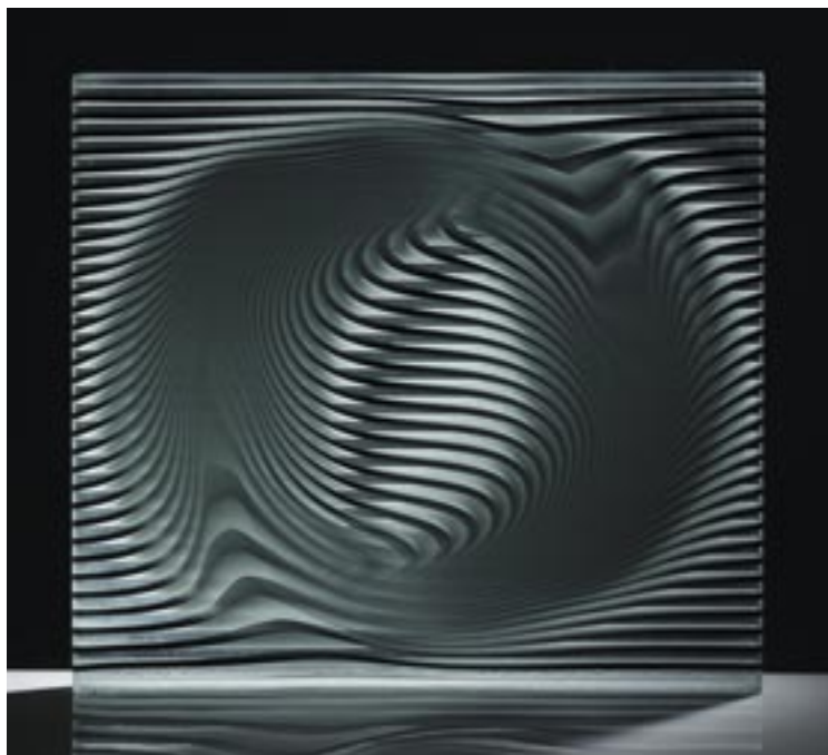
Borkovics Péter: Imagine Rotation , 2013. (összeolvasztott színes síkúveglapok, melegen formázva, csiszolt, polírozott, 48x42x3,5 cm) Magántulajdon