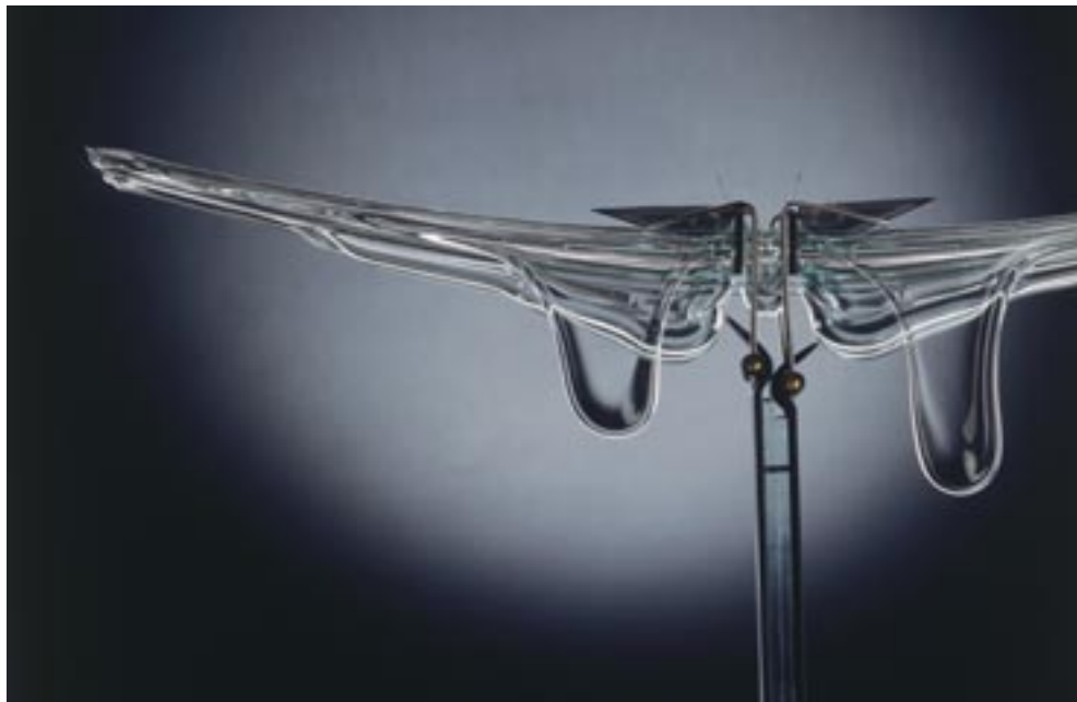
Borkovics Péter: Dongó állólámpa (felső részlet) , 1994. (üveg, fém, függesztett rogyasztás, 185x70x25 cm) Iparművészeti Múzeum, Budapest.