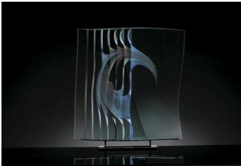
Borkovics Péter: Amorf . 2020. (összeolvasztott síküveg, 40x40x8 cm)