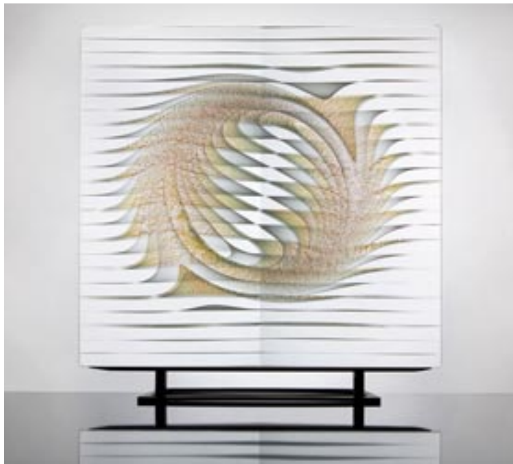
Borkovics Péter: Rising Sun , 2019. (összeolvasztott síkúveg, 38x39x4 cm)