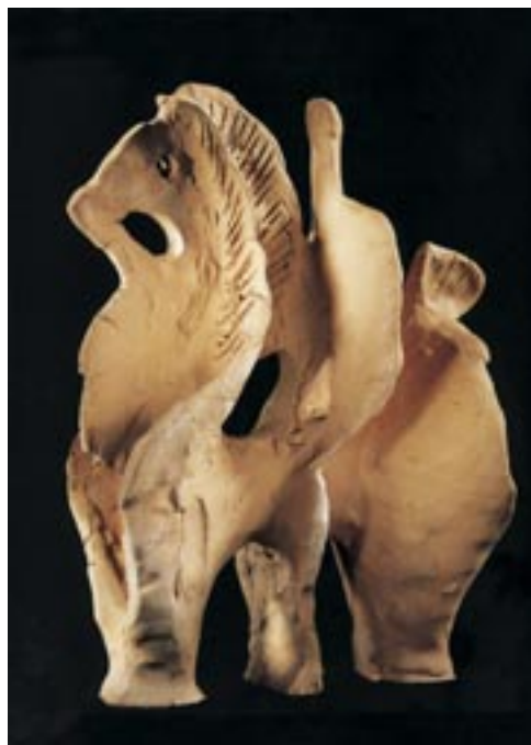
Csekovszky Árpád: Lovas, 1959. (terrakotta, 25 cm)