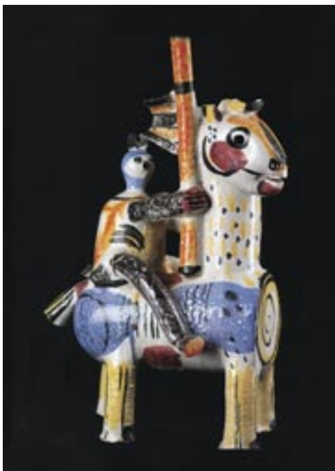
Csekovszky Árpád: Lovas harcos , 1966. (mázás kerámia, 48 cm)