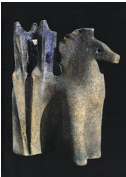
Csekovszky Árpád: Három lovas , 1972. (oxidál és mázzal színezett, 57 cm)