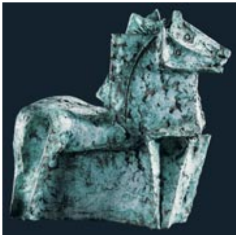
Csekovszky Árpád: Lovak , 1976. (mázás kerámia, 43 cm)

hogy az ugyancsak jelentős kerámia-gyűjteménnyel rendelkező pécsi Janus Pannonius Múzeum tizenhét alkotását őrzi. A pécsi múzeumi Csekovszky-kollekció három 1960-as években alkotott munka ( Harcosok 1960, Nagy lovas 1961, Mesélő 1968) mellett az 1970-es évek lovas- és kocsihajtó-kompozícióira koncentrál (pl. Kocsihajtó csoport 1970, Lovas szekér 1970, Három lovas 1970), de az ugyancsak jelentős műcsoportra utaló Keresztvivők -kompozíció (1975), és két elvont, geometrikus Térkonstrukció (1977, 1980) is jelen van az együttesben. Az átfogó nemzetközi kerámiaművészeti kontextust megteremtő kecskeméti Nemzetközi Kerámia Stúdió gyűjteménye – amely öt kontinens 44 országából (és a különböző magyar településekről) Kecskemétre érkezett csaknem ötszáz művész mintegy háromezer alkotását őrzi – három Csekovszky-művel büszkélkedhet: az 1969-ben alkotott Lovassal , az 1992-ben készített Fekvő idol drapériával című művel és az 1994-es Sírbátétellel . (A művész többször dolgozott Kecskeméten, az „agyag kolostorában”, 1992-ben és 1996-ban a Stúdió ösztöndíjasa is volt.)