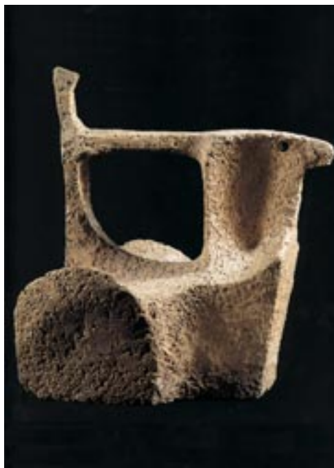
Csekovszky Árpád: Kocsihajtó, 1962. (samottos terrakotta, 38 cm)