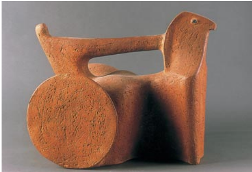
Csekovszky Árpád: Kocsihajtó, 1967. (samottos terrakotta, 46 cm)