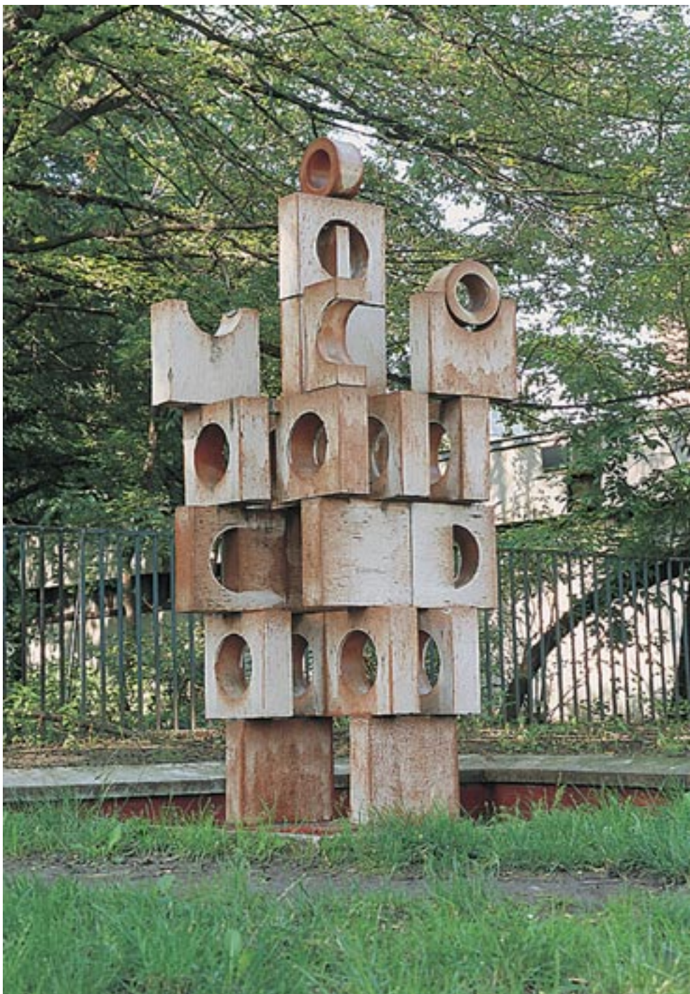
Csekovszky Árpád: Térplasztika, díszút . 1978. (mázas pirogránit, 300 cm) Bp., XVII. ker., Fotók: Csekovszky Balázs