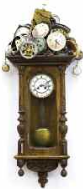
„Száz év magány”, 2016.