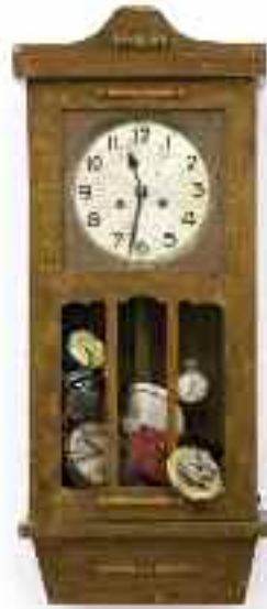
Elveszett óra, 2016.

halmozása, egymásra rakódása; a kifinomult ingák, rugók, kerek a fölöslegesség érzetét keltik: nem lehet végső bizonyosságunk az időről, amely napjaink kísértője. Az idő megréfal bennünket, csúfot űz belőlünk: miközben megpróbáljuk mérni és követni, ő túlesz rajtunk: így könnyen a kiábrándultság és csalódottság érzése támadhat bennünk. Szlávics óraszobrainak groteszk formái csúfondárosan mutogatnak felénk, így emlékeztetve bennünket az elmúlás elkerülhetetlen voltára. Egyik óraszobra (Száz év magány) antropomorfvonásaival hasonló a barokk festményeken ábrázolt öreg kurtizánhoz, aki saját maga egykori vonásait keresi a tükörben, mint François Villon szép kovácsnéja.