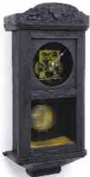
Sötét óra, 2017.