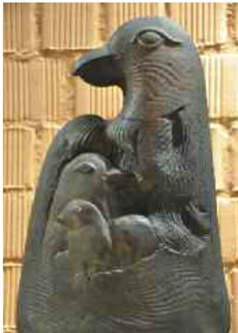
Bánat és Öröm (részlet), 1997