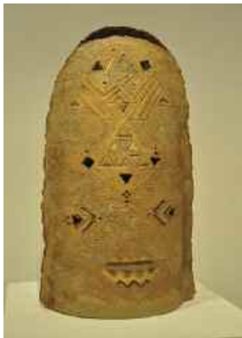
Őseink pajzsa, 2000