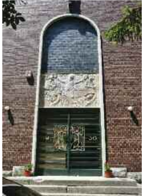
„Színeváltás” – (Transfiguratio), 2016. Komárom, Jézus Szíve-templom

A kiállítás címe: föld-víz-levegő-tűz, a négy őselemre, az élet, létezésünk alapvető, nélkülözhetetlen négyes feltételrendszerére hivatkozik, és mindezeket egyszersmind a kerámiakészítéshez elengedhetetlen összetevőkként is számba veszi. Talán nem véletlen, hogy e műtárgyak létrehozását ugyanazok az elemek determinálják, mint létezésünket. De ezen általános feltételek és jellemzők mellett van még egy nélkülözhetetlen tényező: a sajátos, a személyes jelleg, hogy a művészi megszólalás érvényes és hiteles legyen. A személyesség által hitelesített, a kézzel alkotott művészet tárgyai, az egyedi művekre egyre nagyobb szükségünk van a technikai civilizáció, a tömegtermelés, az eredetiséget mellőző, a mindent reprodukcióvá és olcsó fogyasztási cikké silányító korunkban. A kézzel alkotott, a közjeggyel hitelesített, a szellemiséggel