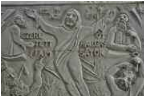
Jézus Szíve-templom domborműve (vázlat), 2014