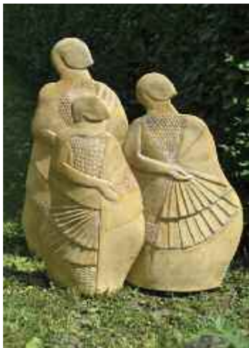
Három grácia, 2015