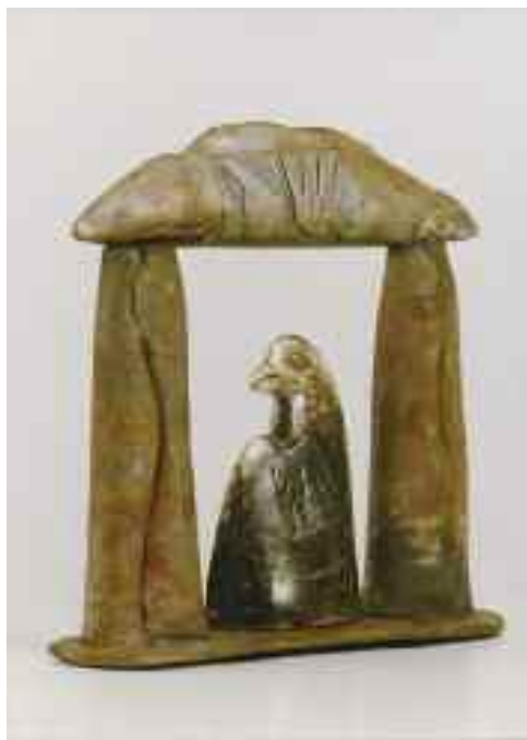
Madárkapu, 1994 (Új-Zéland)