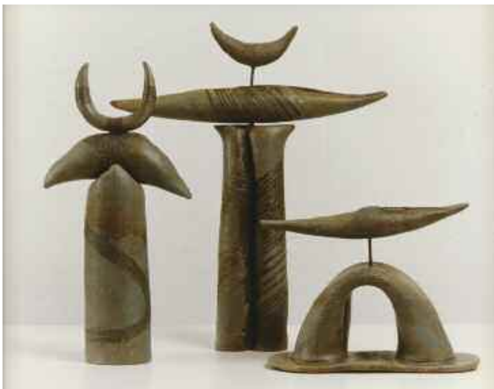
Indiai jelek, 1996

lehetnek egy-egy teljes kompozíció szervezésében, vagy a részletelemek, a felületi díszítés, a téri rendszerek, a belső terek létrehozásában is. Nagyon fontos jellemző jegye a Szemereki-kerámiáknak a térbe-állítás, a térszervezés: hol zárt, héj- vagy kéregszerű felületekkel, palástokkal övezett, üreges a kompozíció teste, hol pedig áttörésekkel, rácszerűen megbontott, a teret mintegy magába olvasztó. A zárt testek esetében a lágyan domborodó, ívesen meghajló felületek hordozzák a fakturális díszítéseket és a színeket, míg az áttört kompozíciók a szerkezetet, a konstrukciót tárják fel a szemlélő előtt. Minderről, a figurativitásról és absztrakcióról, az organikus és a geometrikus jellegű motívumok jelenlétéről a kiállítást kísérő vallomásokban így fogalmazott a művész: „A térplasztikáknál és a murális munkáknál az ütköztetés, vagyis az ellentétek kiemelése foglalkoztat. A geometrikus és organikus formák egymás mellé helyezésével,