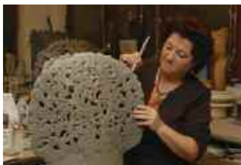
Munka közben a műteremben.