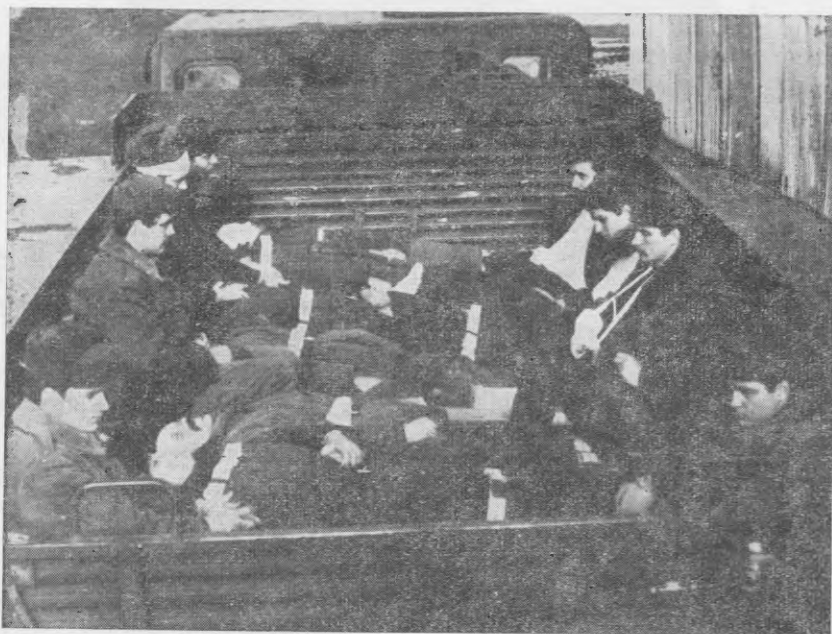
3. sz. kép