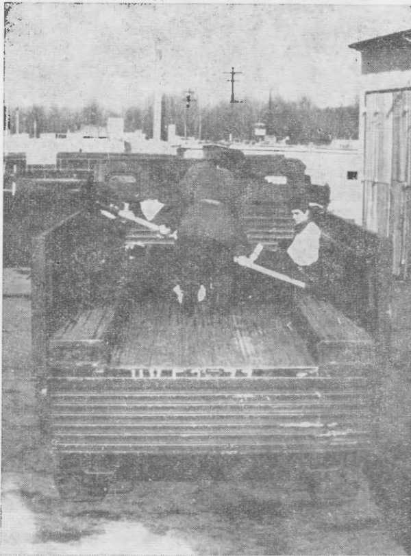
5. sz. kép

Amennyiben csak a gépkocsivezetők állnak rendelkezésre a felrakáshoz, úgy 2 fő gépkocsivezető először felrakja a hordágyakat a rakfelületre, a 4. sz. kép szerint. Miután a hordágyat a gépjármű rakfelületére felrakták, felszállnak a gépjárműre és a hordágyat a helyére rakják, az 5. sz. kép szerint.