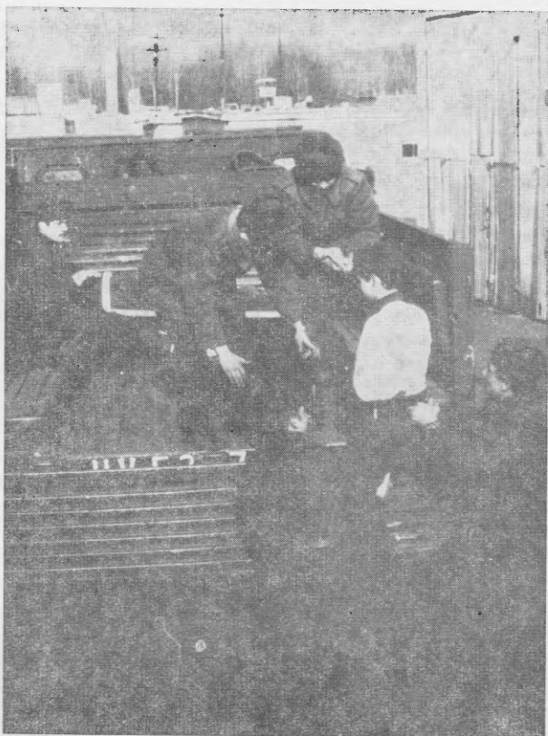
6. sz. kép

A 3. sz. képen jól látható a sebesültek elhelyezése és érzékelhető az, hogy a súlyosan sérült betegeket a könnyebben sérültek a szállítás ideje alatt el tudják látni, segítséget tudnak nekik nyújtani. A sebesültek elhelyezése nem akadályozza a gépkocsira rendszeresített ponyva felszerelését. Célszerű, illetve lehetséges a gépjármű-vezetőfülke tetejére előre elkészített vöröskereszt felrakása. A CS-D-566-os terepjáró, összkerék-meghajtású szállító-tehergépkocsi igen jó üzemi és menettulajdonságokkal rendelkezik. A végrehajtott próbákon, gyakorlatokon igen nehéz terep útvonalakon képes volt szállítási feladat végrehajtására, úgy, hogy az imitálás céljára beállított sebesültek (orvos-tisztek, egészségügyi tiszthelyettesek) a sérültszállításnak ezt a módját kíméletesnek tartották.