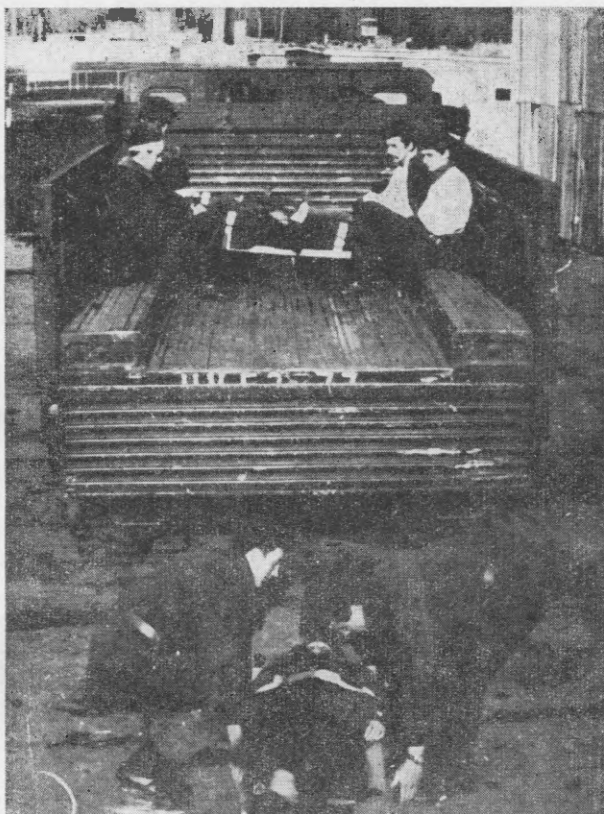
4. sz. kép

A 4. sz. kép érzékelteti a hordágy földről való felemelésének módját a gépjármű rakfelületére.