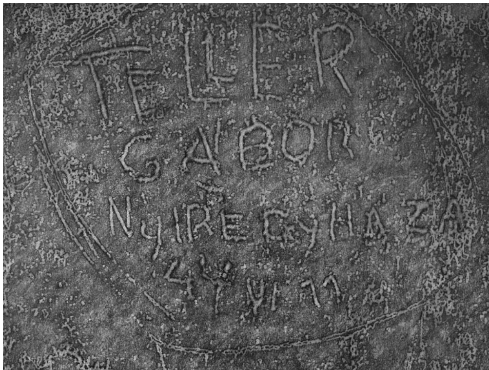
RAJK LÁSZLÓ Hiányzó sors, 2012, (részletek)

Mert a „nincsbe” taszítottaknak, a személytelen számmal számon tartottaknak a „jelek e legjelebbike”: a nevük megmaradt. Ha azt kőbe vésik, nem merülnek örök feledésbe, ebbe a nincs-be, ami maga a mindent elnyelő sötétség. Fekete lyuk.