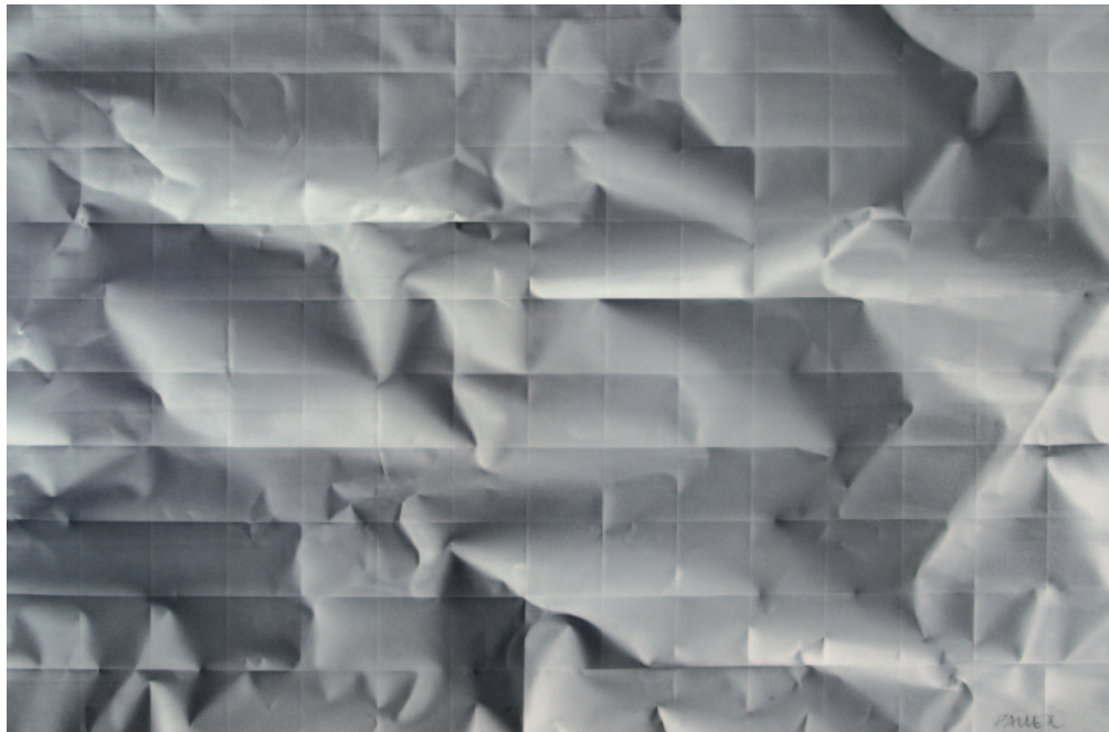
PAUER GYULA Szürke struktúrák, 2012, akril, vászon