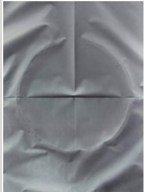
PAUER GYULA Homályos emlék, 2012, akril, vászon

veszély érzetét keltik. Ez a legnyugtalanítóbb műve. A Mintázaton téglatestek, szimmetrikus rendszerek ütköznek meg a roncsolt felszínnel. Szikora doboza című művét pedig kollégájának ajánlotta. Ez nem gesztusfestészet, hanem a festő gesztusa. A lepellel takart, egy konkrét objektire utaló művén a doboz szélei kinyílnak, szárnyalni akarnak. Költői munka. Pauer Gyula