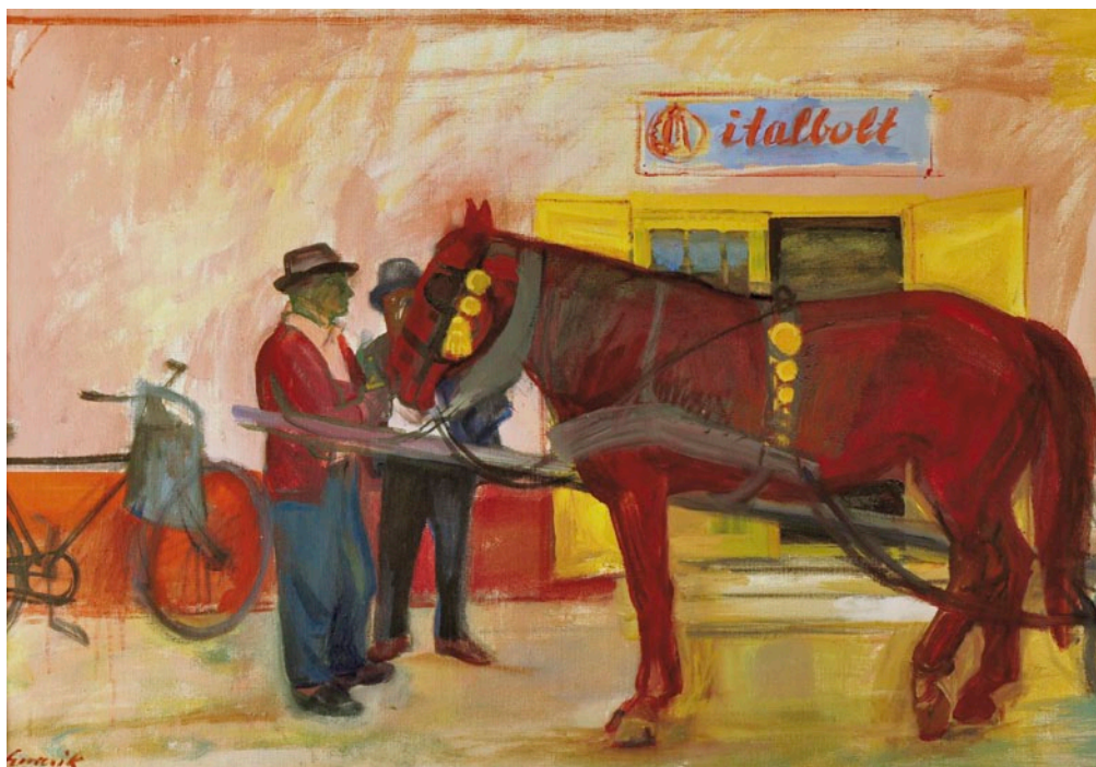
SZURCSIK JÁNOS Italbolt előtt, 1977, olaj, vászon, 55 × 80 cm

új realistáknak nevező festők a szocialista realizmussal szemben a valóságra hivatkoztak és így a maga valójában jelenítették meg a falusi életet. Éppen ezért a vásárhelyi iskola szellemileg sokkal közelebb áll a szociofotóhoz, mint a szocialista realizmushoz.