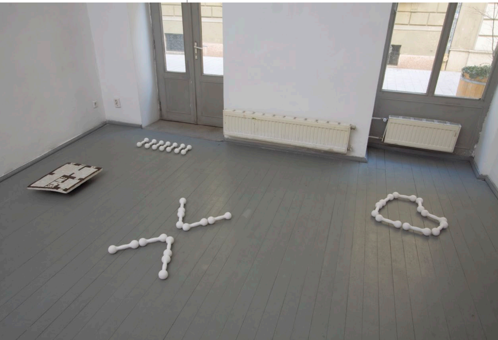
KÁLDI KATA Vas. Káldi Kata kiállítása, Labor, Budapest, 2011, (kiállítási enteriőr), © Fotó: Sulyok Miklós