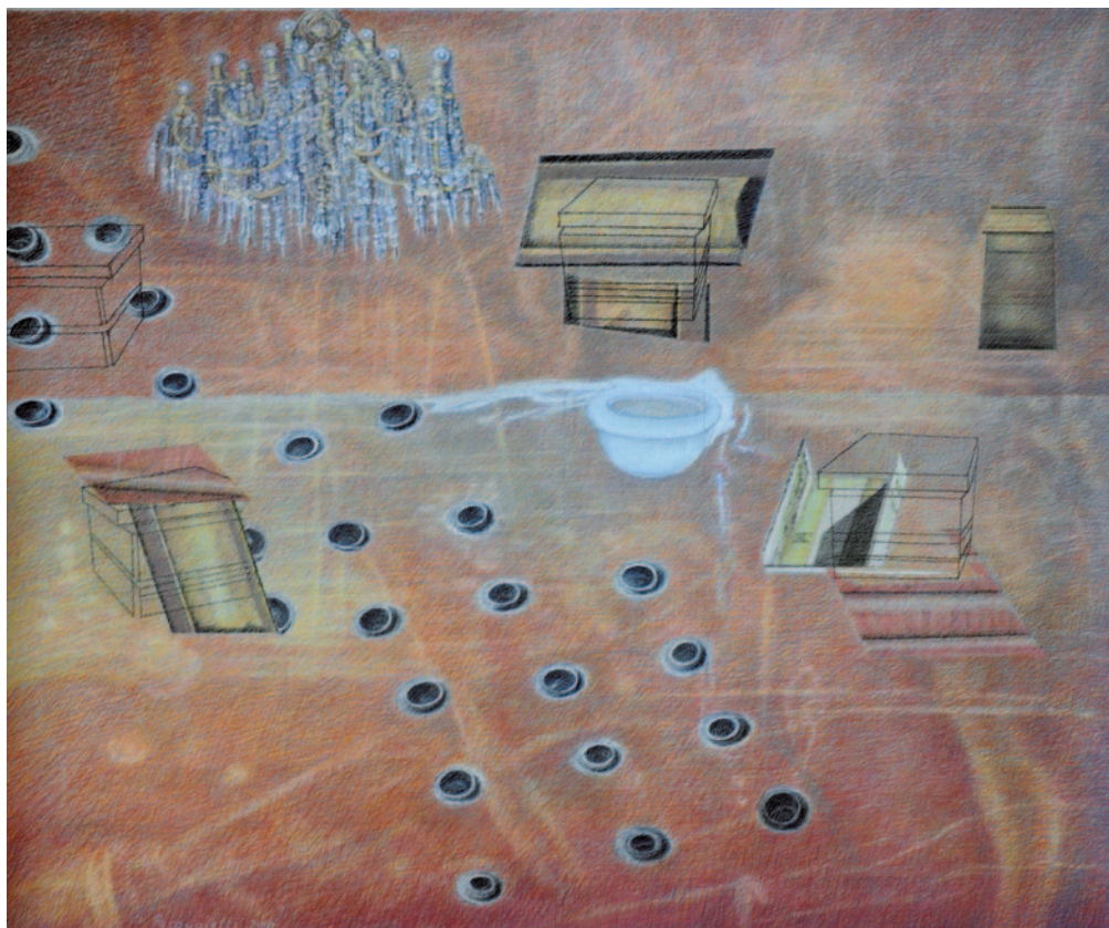
PASQUALETTI ELEONÓRA Átkelés / Traversata, 2010, pasztell, egyéni technika, 150 × 150 cm