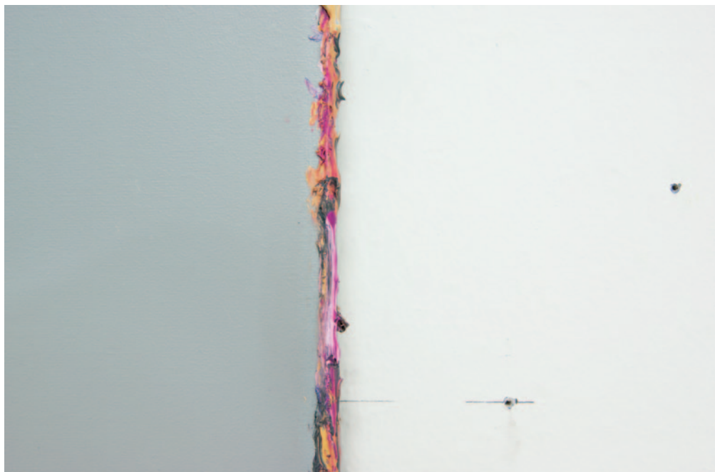
ERDÉLYI GÁBOR Nincs címe, 2010, akril, vászon, 135 × 106 cm, (részlet)