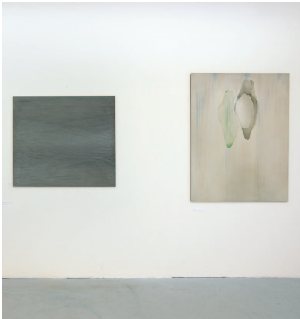
SUSANNE CIRKEL: im Schneelicht geboren, 2006, akril, vászon, 105 x 120 cm (balra) SOMODY PÉTER: Kagyló, 2001, akril lakk, fatábla 150 x 120 (jobbra) © Fotó: Eln Ferenc

Kiállítási enteriőr. Hattyúház Galéria, Pécs © Fotó: Eln Ferenc