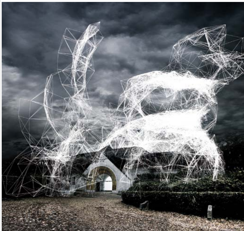
DOUBLENEGATIVES ARCHITECTURE Corpora in Si(gh)te, koncepciórajz, Velencei Építészeti Biennálé, 2008 © fotó: doubleNegatives Architecture

DOUBLENEGATIVES ARCHITECTURE Corpora in Si(gh)te, Velencei Építészeti Biennálé, 2008 © fotó: doubleNegatives Architecture