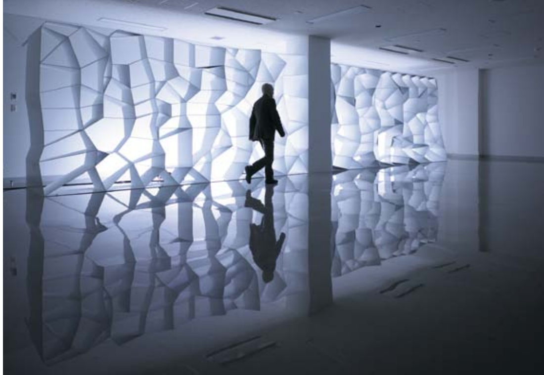
DOUBLENEGATIVES ARCHITECTURE Algorithmic Wall, Tama Art University, Tokió, 2007 © doubleNegatives Architecture

☘ Míg a Corpora – mint a generatív művek általában – mesterségesen próbál egy életszerű konstrukciót létrehozni, itt a másik oldalról akartam megközelíteni ugyanazt. Az volt a cél, hogy élő konstrukciók hozzanak létre valami olyat, amit általában mesterségesen állítunk elő.