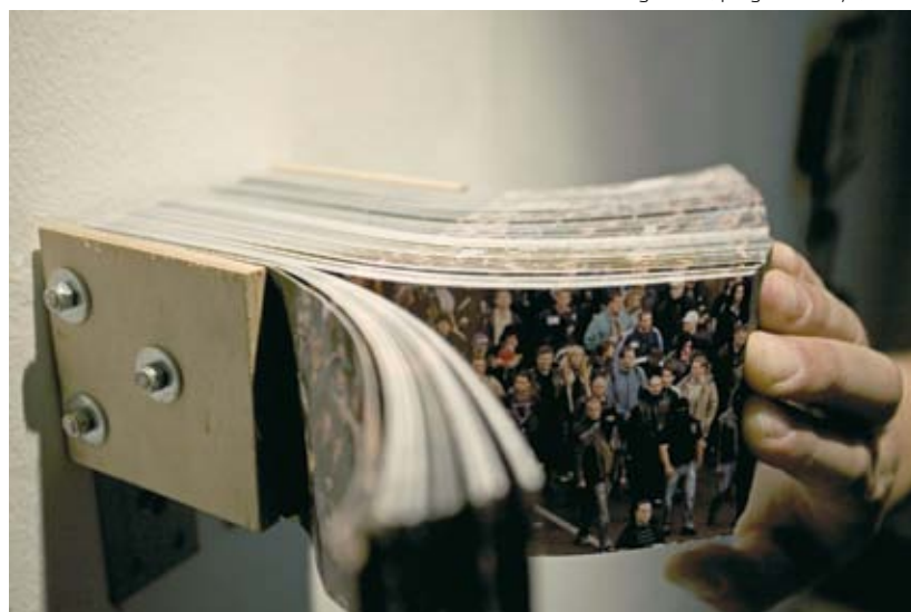
ZÁDOR TAMÁS Kergetőzés, pörgetős könyv, 2008