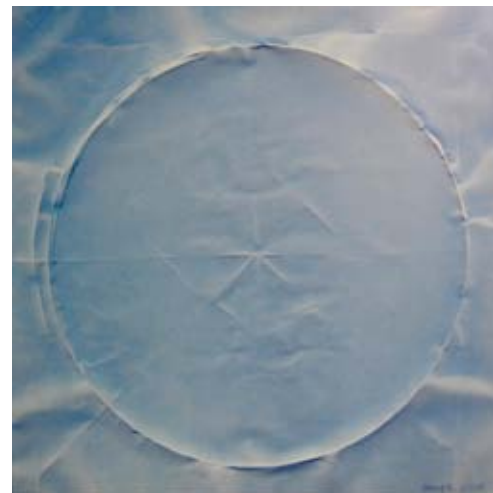
PAUER GYULA Éteri korong, 2008, akril, lakk, vászon, 150×150 cm

A másik fontos megjelenés egy, a PSEUDO-konceptiót nemzetközi összefüggésbe helyező összefoglaló esszé, melyet Wolf Günter Thiel, a Flash Art International