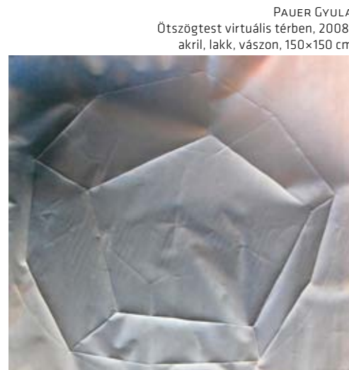
PAUER GYULA Ötszögtest virtuális térben, 2008, akril, lakk, vászon, 150×150 cm