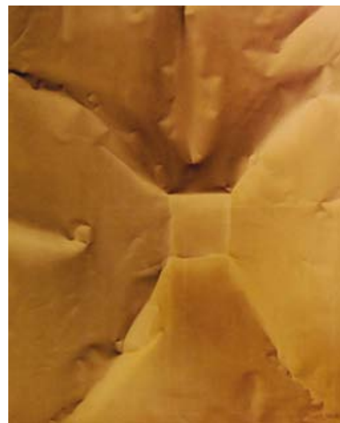
PAUER GYULA Csatolt fent és lent (Euklidészi geometria), 2008, akril, lakk, vászon, 150×120 cm