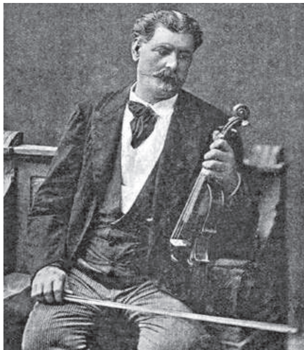
Idősebb Rác Pali

Az olasz-magyar zenei kölcsönhatásban nem csak a klasszikus neveltetésű művészek játszottak fontos szerepet, hanem a 19. században Itáliában játszó cigány muzsikuskok is. Közöttük Rác Pálnak (1815–1885) lehetett a legnagyobb befolyása az olasz zenére, mivel több mint két évtizeden át muzsikált a félsziget északi részén. Tizennyolc évig szolgált a főként Milánóban állomásozó 33-as „Gyulai” ezredben, és katonatársaival húsz tagú együttest alakított. De nem csak játékával szerzett hírnevet: 1848-ban, az olasz forradalom idején hírszerzőként is szolgált, és ő szabadította ki a fogságból Vlagyimir orosz herceget. Utóbbi tettéért Szent György kereszttel tüntették ki, amire élete végéig büszke volt. A daliás termetű muzsikusról feljegyezték, hogy a szerelemben nagyon szerette a változatosságot (a legenda szerint összesen 36 gyermeke született). Végül a jómódú olasz nőt, Gindita Ferrariót vette el, akivel boldogan éltek Milánóban. Csak amikor elfogyott a hozomány, tért haza Magyarországra, és indult nagy sikerű nyugat-európai turnéira. 1885-ben bekövetkezett halála után a még Itáliában született fia, ifj. Rác Pali (1852–1926) vette át az együttes irányítását.