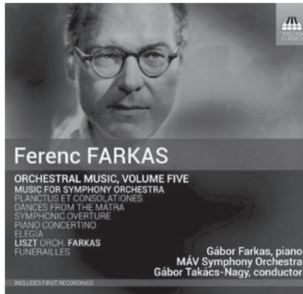
Farkas zenekari és versenyműveinek 5. albuma, melynek első száma a Planctus et consolationes (Toccata Classics 2017)

A mű tehát a címben jelzett kétféle lelkiállapot, a gyász és a vigasztalás váltakozásait sűríti egyetlen tételbe. Kétségkívül programzenéről van szó, amelyet Farkas így jellemezett: „ Villánási, egymásba olvadó tétéleiben [...] a halálhír döbbenete, a gyászindulók komor lüktetése, az elmúlt időket idéző fátyolozott derű, a kikerülhetetlen halál ellen való hasztalan lázadás hangja, majd megnyugvást, vigasztalást kereső hangulatok sora-