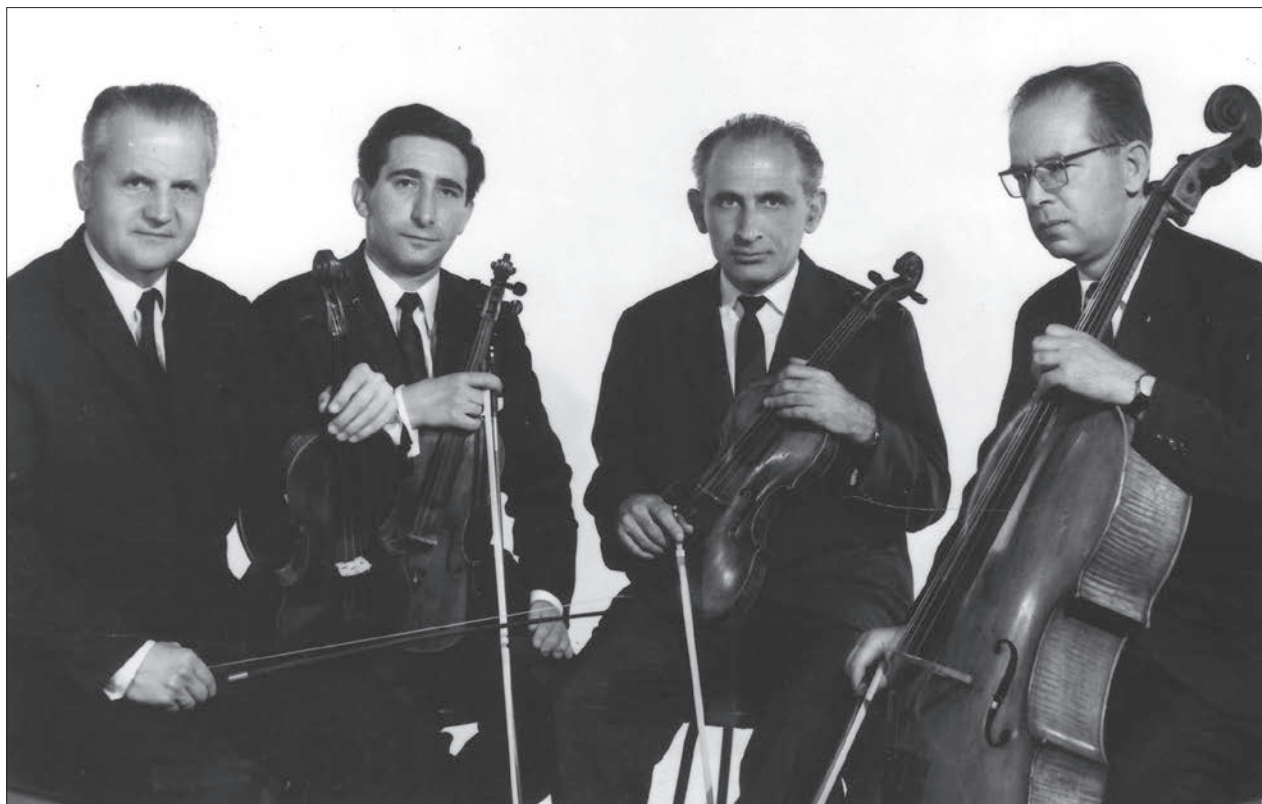
A Tátrai Vonósnégyes