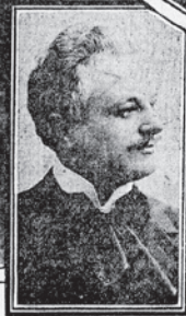
Karoly de Ferenczy.