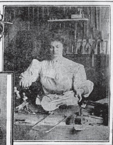
Doing the "Purple" or Inlaying.

To be eighteen years old, very pretty, possessed of a wonderful talent and a wonderful secret worth tens of thousands of dollars, would seem enough to turn any girl's head.