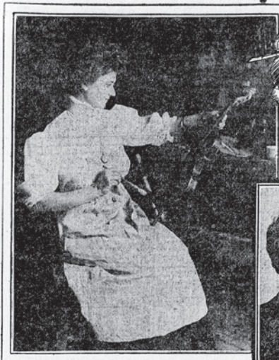
Putting on the Last Coat of Varnish.