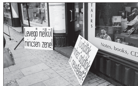
A tüntetők által elhelyezett táblák

Mit is jelent ez? A helyszín egyszerre üzemi hangverseny teremként, kiállító térként, közösségi térként, miközben illeszkednie kell a környezetbe és a modern építészet design-elvárásaihoz. Így az épület tulajdonképpen három rétegre tagolódna, egy installációs/kiállítási, egy múzeum- és koncert pedagógiai, illetve egy élményszerű hangversenytermi rétegre. Az építész terve nem titkoltan lép párbeszédbe a párizsi Cité de la Musique és a bécsi Haus der Musik épületeivel, amelyek elsősorban a közönség felé fordulnak és a zene megszerettetését tűzték ki célul. Sou Fujimoto terve ( http://www.intezmenyek.ligetbudapest.eu/hu/places/jovo/ma-