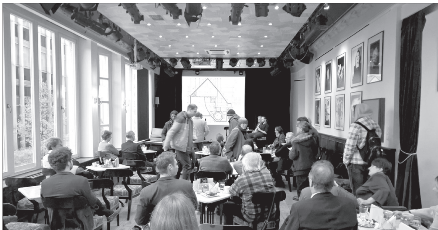
A tüntetők az előadást is megzavarták

A tízezer négyzetméteres telek, amely a hetvenes évek óta nem képezi a park részét, kerül majd átalakításra, és a rajta található kilenc épületet (volt Hungexpo irodaházak) sem használták semmire. Emellett a helyszín a tókapcsolat miatt kiváló, ráadásul a jelenlegi – talán kicsit méltánytalanul – „betonteknő”-nek titulált mostani tó is meg fog újulni komoly parkosítás kíséretében.