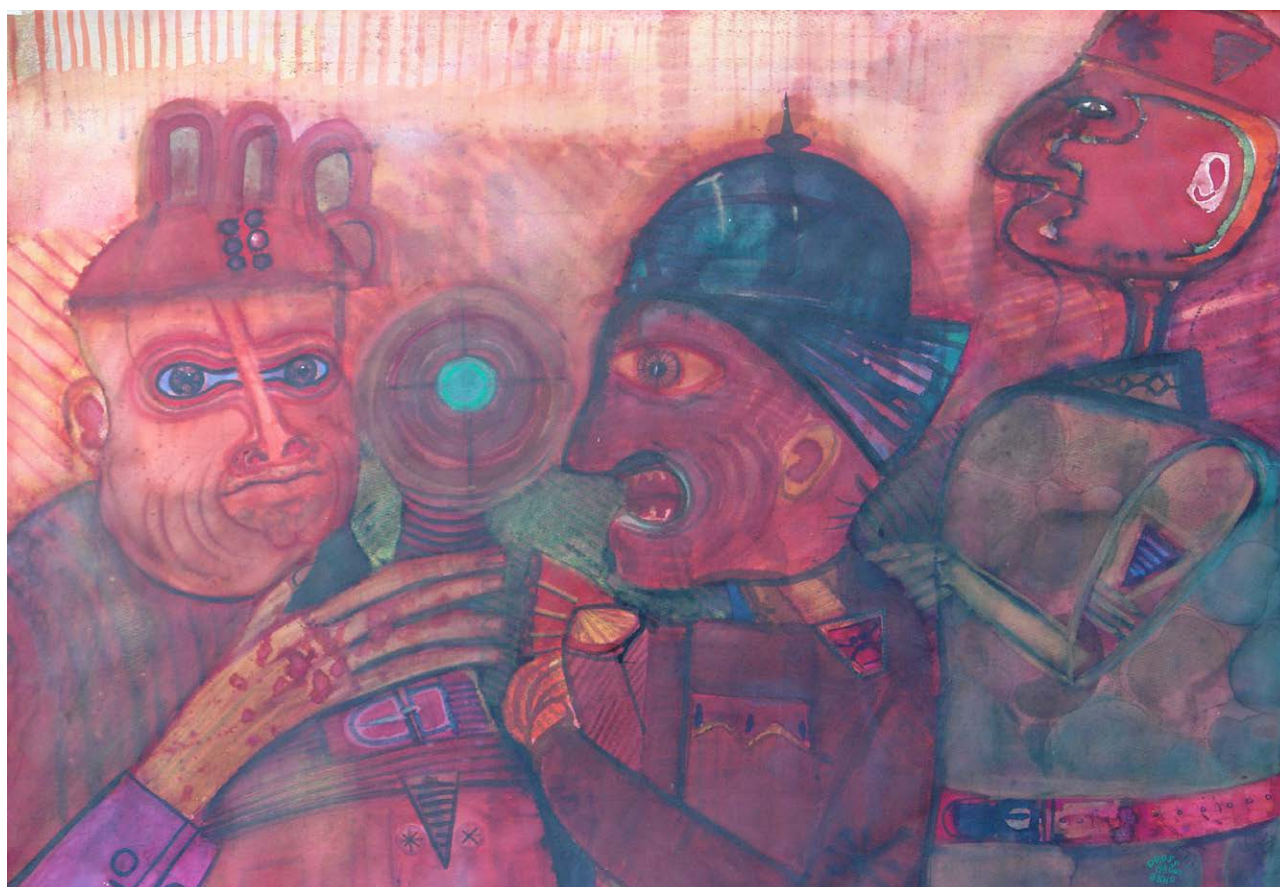
OROSZ János: Gonoszok , 1980, akvarell, papír, 70×100 cm HUNGART © 2021 ←

révén sikerült legyőznie. 1963 volt az az év, amely fordulópontot jelentett életében. Szinte párhuzamosan kapta meg a Római Magyar Akadémia két hónapos ösztöndíját és a Munkácsy-díjat. Itáliai tartózkodása végül két évre sikerredett. A művész úgy robbant be a szakmába, mint kevesen előtte, bár pályáját pro és kontra kritikák kísérték. Én inkább arra emlékeznék, hogy volt, aki már igen korán észrevette Orosz kivételes tehetségét és másokétól élesen megkülönböztethető látványvilágát. Sík Csaba 1961-ben – tehát Orosznak a fent említett beérkezése előtt – már azt írta a művészről, hogy „ábrázolása néha karikatúrára emlékeztet. De a groteszk nem a nevetetést szolgálja, bizonyos tulajdonságok taszító hangsúlyozását a látomás egészében, hanem az együttérző részvétet jelenti, a valóság lényegéhez hű társadalmi célzatot [...]”. A művész saját ars poeticájában pedig úgy határozta meg látomásos művészetének célját, hogy annak „az egyensúly, az őszinteség, a látott és a tapasztalt valósághoz, az emlékekhez való hűség a pillérei”. Orosz ennek a hűségnek a jegyében sohasem tudott elszakadni az ábrázoló, figurális reprezentációtól. A művek fragmentumaiban ugyan képes volt az