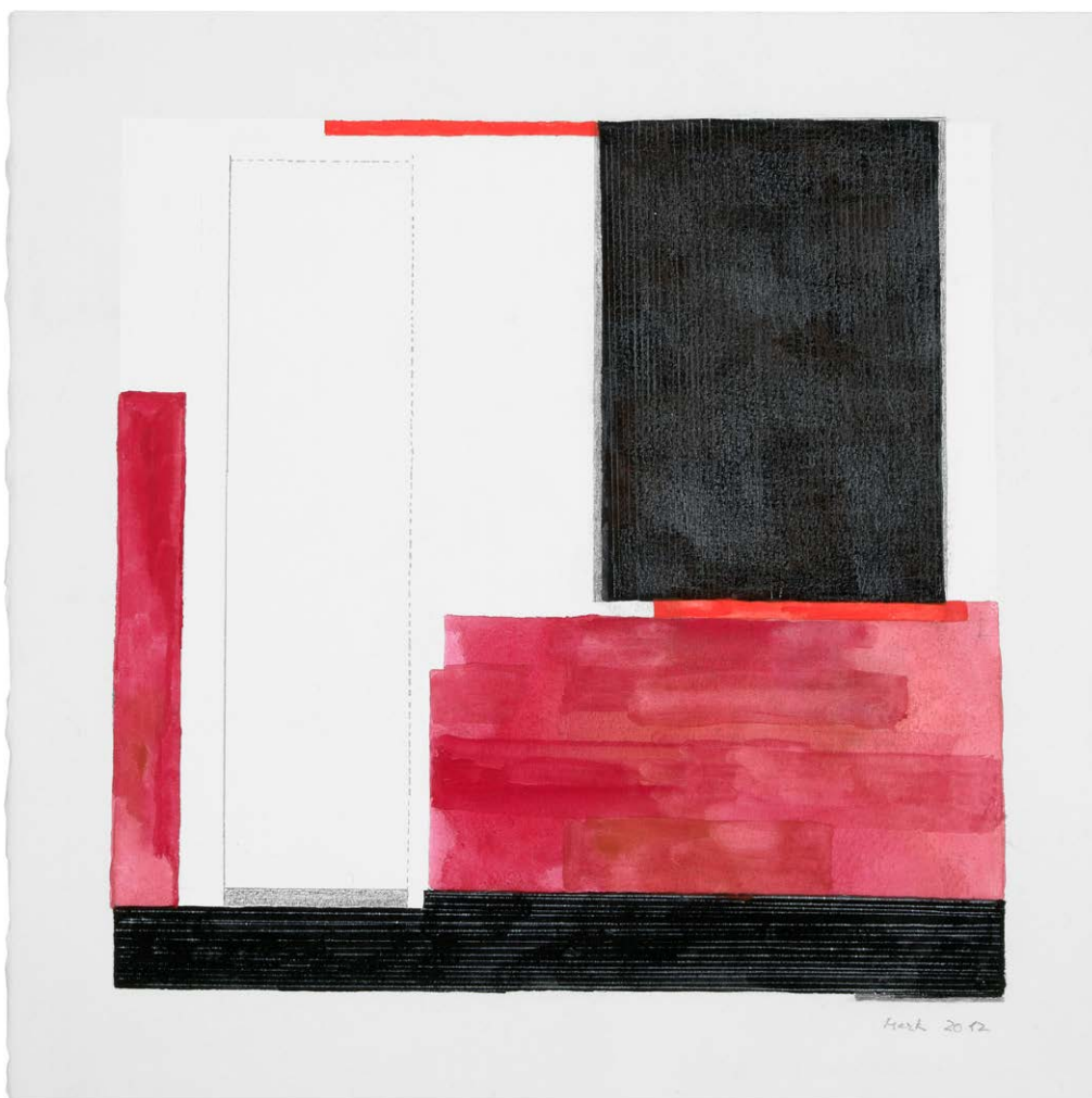
↑ Anna MARK: G-284, 2012, gouache, 40×40 HUNGART © 2021