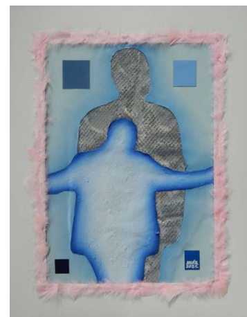
VARGA-AMÁR László: Figurák tollszegéllyel , 2021, olaj, papír, szúnyogháló, madártoll, 90×70 cm

Varga-Amár László tárlata Vízivárosi Galéria, 2021. május 19. – június 14.