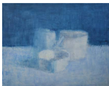
KIRÁLY György: Lin-csi csendje , 2019, olaj, lenvászon, 100×130 cm

Király György egyéni kiállítása Damjanich János Múzeum, Szolnok, 2021. május 29. – július 25.