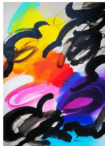
KESERŰ Ilona: Küzdelem 2. , 1991, olaj, grafit, zománc, vászon, 140×100 cm Szilka Balázs magántulajdona

25 éves a pécsi Művészeti Kar FUGA Budapesti Építészeti Központ, 2021. június 10. – július 4.