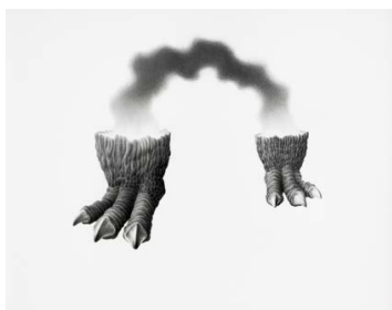
GALLOV Péter: ZuZuFu , 2020, grafit, papír, 35×42 cm

Gallov Péter egyéni kiállítása PINCE, 2021. június 10. – június 27.