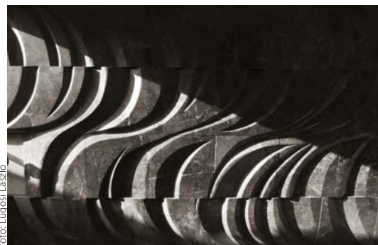
JÓZSA BÁLINT-KOVÁCS FERENC: Dinamikus dombormű, Déli pályaudvar, aluljáró, végfal, 1974, Budapest

A két óbudai múzeum kiállításával az 1927-ben született drezdai képzőművész, Karl-Heinz Adler munkásságának bemutatására vállalkozik. Az idén 90 éves Adler a német absztrakt művészet fontos alakja, újralfedezése napjainkban folyik Németországban. Alkotói tevékenységének jelentős időszakát korlátozta a rendszerváltás előtti kultúrpolitika ideológiája: a néhai NDK területén Adler sokáig háttérbe szorult az absztrakt művészeti törekvéseket elvető szocialista környezetben.