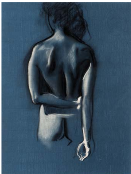
CSERNUS TIBOR: Hátakt, évszám nélkül, szén, fedőfém, papír, 67x49 cm

A KOGART Kiállítások Tihany a 60-as évek közepétől haláláig Párizsban dolgozó Csernus Tibornak , a 20. század egyik legjelentősebb magyar festőművészeinek állít emléket az életmű egy eddig kevésbé ismert szegmensét bemutató tárlattal. Ritka alkalom, ha egy jelentős képzőművésznek a halála után valamilyen formában egyben tartható