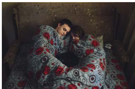
RAMIN MAZUR: Egy pillanat megragadása, fotósorozat

Az Egy pillanat megragadása című kiállítás különböző művészeti dokumentációkat mutat be, amelyek egyazon tárgyról, Kelet-Európa és Oroszország határmezsgyéjén elhelyezkedő