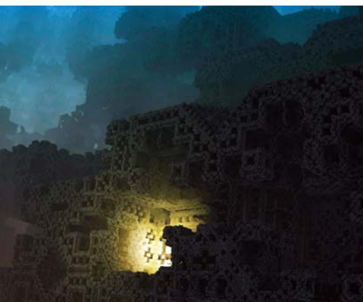
GÁBOR ÉV MÁRIA: Hommage à Lovecraft, 2010, komputergrafika, 50x60 cm

A Pannonhalmi Főapátság 2017-ben, a Közös ház évében a Magyar Elektrográfiai Társaság Hajlék... című kiállítását mutatja be az Apátsági Múzeum és Galéria falai között. A tárlaton 60 művész közel 100 digitális alkotása tekinthető meg. Az igen gazdag kifejezési formákkal megalkotott művek változatos módon jelenítik meg, ki hol talál hajlékot, menedéket, élhető helyet, ahol megpihenhet, meditálhat, tevékenykedhet. Vagy éppen a hajlék