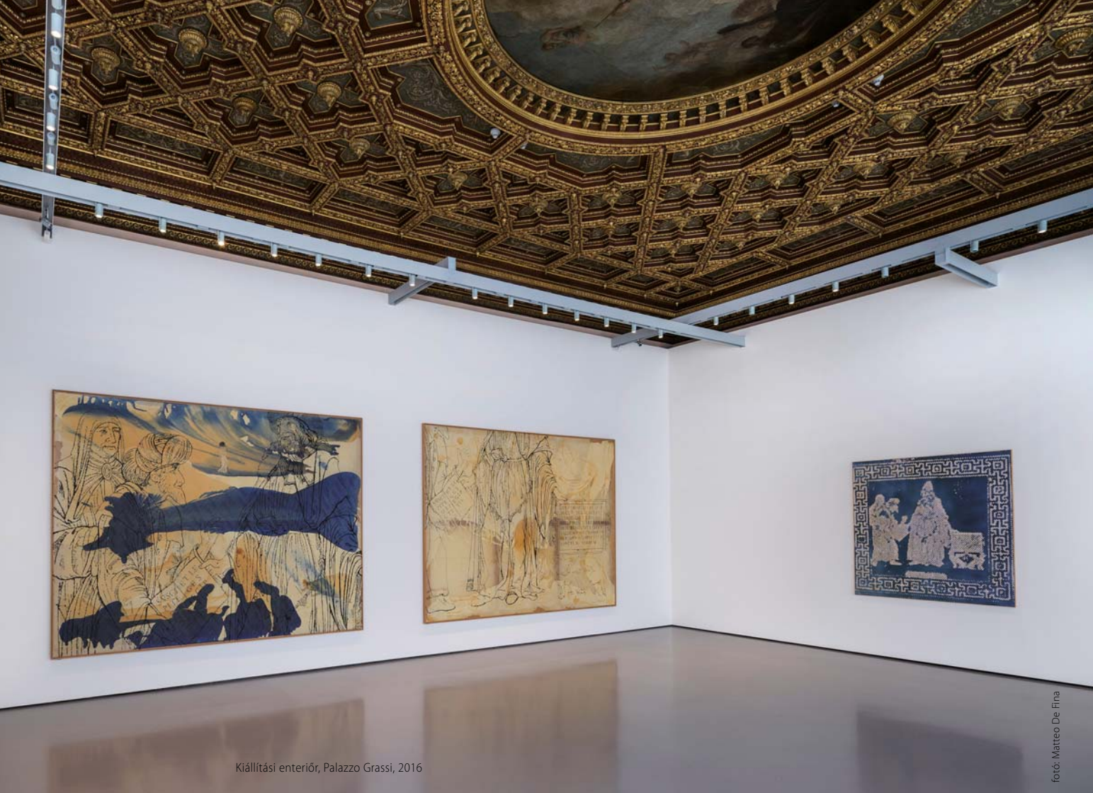
Kiállítási interiőr, Palazzo Grassi, 2016