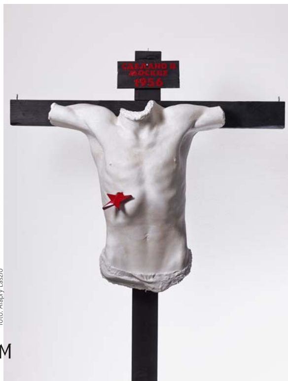
fotó: Alapfy László

BOCSKAY VINCE: 1956, 2016, fa, gipsz, 230x100x30 cm