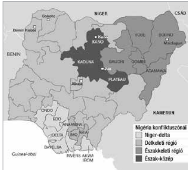
2. ábra Konfliktusövezetek Nigériában 2014 Figure 2 Conflict zones in Nigeria 2014

vidék békéjéért. Ennek is köszönhető, hogy az utóbbi néhány évben e szervezetek erőszakos tevékenysége visszaesett, bár kérdéses, hogy mikor lángol fel újult erővel a küzdelem, ha a jövedelemelosztásban, illetve ebből következően az helyi életkörülményekben nem történik érdemi változás.