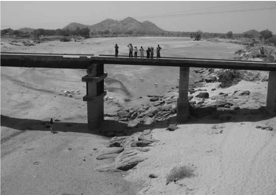
4. kép A száraz évszakban ideiglenesen kiszáradt folyómeder Sokoto államban Photo 4 Temporarily dry river-bed in Sokoto State during the dry season