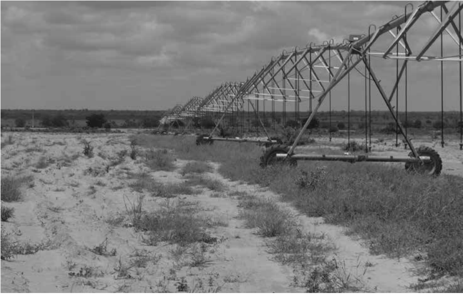
3. kép Használaton kívüli modern öntözőberendezés Zamfara államban Photo 3 Unused modern irrigation equipment in Tamfara State