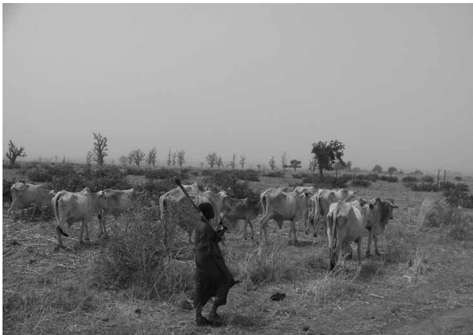
2. kép Életkép a félsivatagos Sokoto államban Photo 2 Everyday life in the semi desert area of Sokoto State

Nigéria területe, földrajzi elhelyezkedése okán, éghajlati szempontból folyamatos átmenetet képez a Szahara és az egyenlítői trópusi övezet között. Bár az ország területébe a Szahara teljesen terméketlennek mondható sivatagos részei (ma még) nem nyúlnak be, Nigéria legészakibb szegélye része a Száhel-övezetnek, amely egyre inkább terjeszkedik déli irányba (2. kép). Ennek következtében nagyon jelentős különbségek vannak az ország egyes régiói között, amely úgy népsűrűségben, mint például a mezőgazdasági potenciálban is tetten érhető.