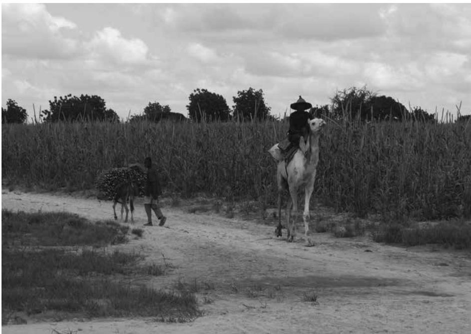
1. kép Cirokültetvény Zamfara államban Photo 1 Sorghum plantation in Zamfara State Forrás/Source: a szerző saját felvétele/own photo of the author (2008)

kodás. A Világbank adatai szerint az ország területének mintegy 76,9-79,1%-a művelésre alkalmas földterület (The World Bank Group, 2015), ami az ország teljes területét figyelembe véve mintegy 70-73 millió hektárt jelent. Az ország tehát hatalmas mezőgazdasági potenciállal rendelkezik, ám e termőterületnek kevesebb, mint felén folyik művelés és a termelés hatékonysága a modernizáció hiánya miatt alacsony (1. kép). Nigéria lakossága emiatt jelentős, mintegy évi 6,4 milliárd USD értékű élelmiszerimportra szorul. Ez a kettősség már szinte kezdettől fogva fennállt. NWUFOH, F. C. (1986) tanulmányában rámutatott arra, hogy a mezőgazdasági termékek importja 1962 és 1982 között ötszörösére növekedett. A függetlenség elnyerésének évében, 1960-ban a mezőgazdaság a GDP 63,3%-át adta, míg húsz év múlva, 1980-ban már ennek csak egyötödét (20,5%). Hozzá kell tenni, hogy az idézett tanulmány megjelenésének idején Nigéria lakossága és élelmiszerigénye a mainak alig a fele volt.