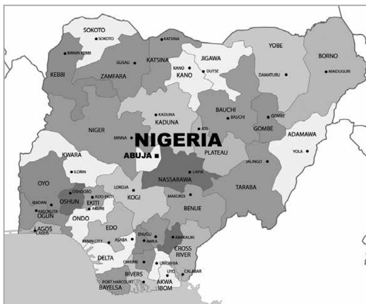
1. ábra A Nigériai Szövetségi Köztársaság közigazgatási térképe Figure 1 Political map of the Federal Republic of Nigeria

részen az etnikai-törzsi megoszlás jóval „tarkább”, az ország délnyugati államaiban nagyrészt a yoruba, míg délkeleti államaiban az igbo (ibó) és számos további nemzetség lakik.