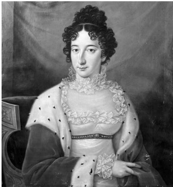
Mária Ludovika császárné–királyné

Mária Ludovika császárné–királyné portréjánál (53.19.24. ltsz., 62,7x76,3 cm) az keltette fel az érdeklődésemet, hogy az ábrázolt hölgy hermelin szegélyes palástot visel.