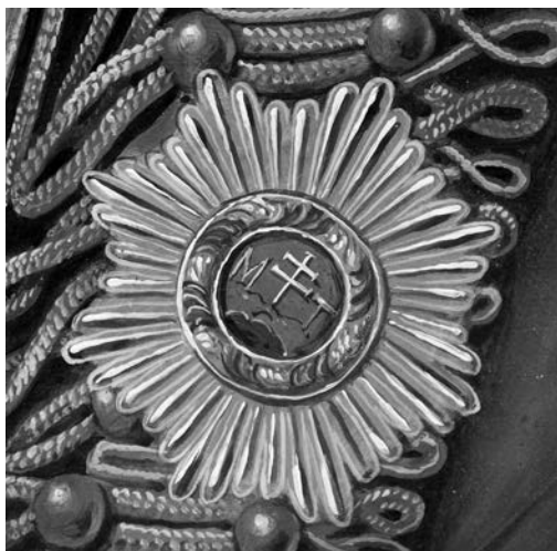
József nádor Szent István Rend nagykeresztjének csillaga (Az előbbi festmény részlete)

(Megjegyzem, hogy a nádor [vagy más személyek] magyar öltözetű tábornoki és huszár ezredtulajdonosi képeit, fekete-fehér reprodukciók esetében, főleg, ha főveg nélkül ábrázolták őket, meglehetősen nehéz egymástól megkülönböztetni. Ebből eredendően a publikációkban számos hibás meghatározással is találkozhatunk! 8