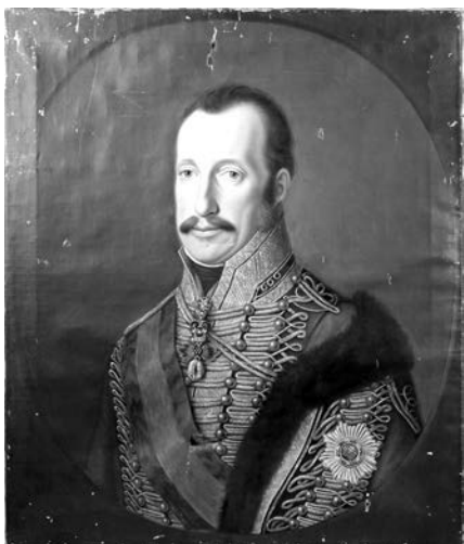
József nádor, mint a cs. kir. 2. „József huszárok” ezredtulajdonosa

A 2-es „József huszárok” világoskék egyenruhát (dolmány, mente, nadrág) és vörös csákót, a 12-es „Nádor huszárok” világoskék, 1803-tól búzavirágkék egyenruhát (dolmány, mente, nadrág) és fekete csákót viseltek. A 2-esek gombjai sárga, a 12-esek gombjai fehér színűek voltak. Ennek megfelelően a 2-esek tisztjei egyenruhájukon arany színű zsinórozást és süjtásokat, a 12-esek tisztjei pedig ezüst színű zsinórozást és süjtásokat viseltek. 6 A fentiek alapján – bár a zirci portré csákó nélkül, hajadonfőtt ábrázolja a nádort – eldönthető volt, hogy, itt a 2-esek ezredtulajdonosaként ábrázolták. Nyakában az Aranygyapjas Rendet, dolmányán az 1795-ben elnyert 7 Szent István Rend nagykeresztjének váll szalagját, mentéjén a nagykereszt csillagát viseli.