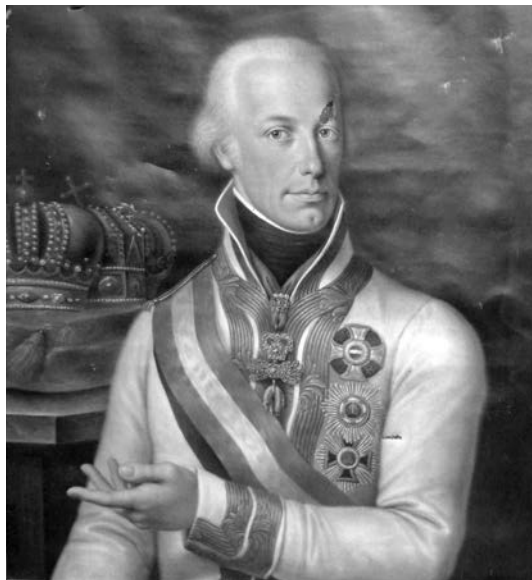
I. Ferenc császár–király cs. kir. tábornagyként

Egy negyedik ugyancsak a zirci apátságból származó festményről eddig is tudtuk, hogy I. (II.) Ferenc császár–királyt ábrázolja (53.10.23. ltsz., 62x75 cm).