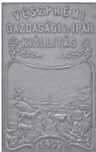
Az emlékérem első oldala

A felállított pavilonok közül – a beszámolók szerint – legdíszesebb volt az Esterházy-pavilon, melyben a vadászatnak jutott a legnagyobb szerep. Tulipándíszes magyaros stílusával – mint írták a lapok – kellemes benyomást keltett a bakonyi háziipar kiállító terme, a budapesti országos kiállítás erdészeti pavilonjára emlékeztet a vadászat, erdészet és bányászat közös épülete, egyszerűségében imponáló az iparcsarnok; az ipari produktumok egyéb iránt nem találtak itt mindnyájan helyet, beszorultak az iskolaépületbe is, melynek folyosóin helyezték el a mezőgazdasági és kertészeti terményeket. Külön kis csarnokban volt a borkiállítás is. Az utak mentén a szabadban a gazdasági gépek egész tömege. Bel- és külföldi gyárosok az egész egyszerű ekétől a legnagyobb