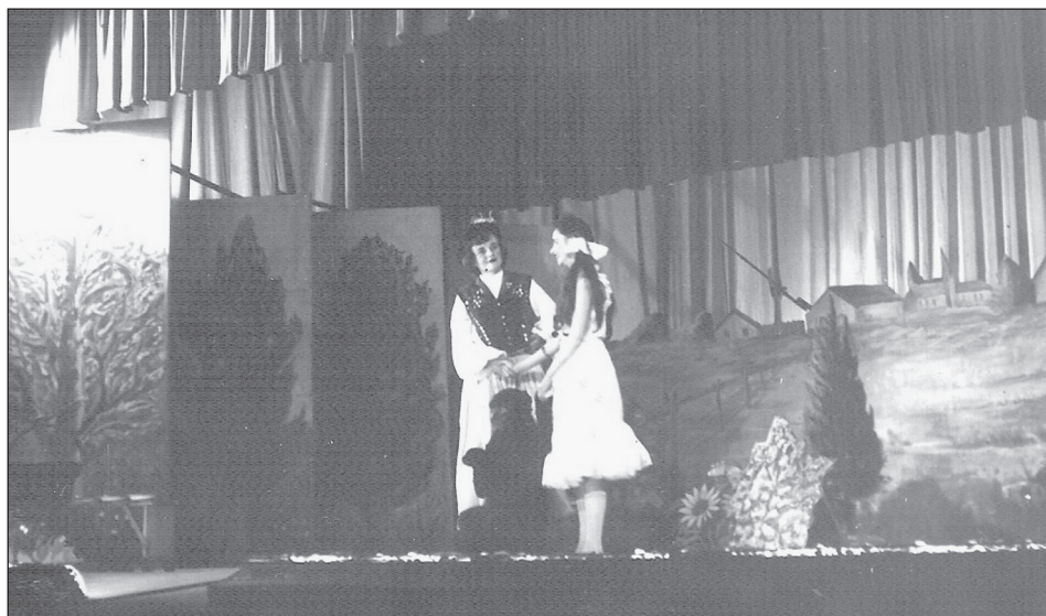
Jelenet A makrancos királynő előadásából.

néhol – szerzői jóváhagyással – egyszerűsítették. Négy alkalommal játszották, egyiken a zeneszerző is jelen volt. Az előadásokat ezúttal is a színházban tartották „nagy erkölcsi sikerrel, a tantestület és a gyerekek elismerő oklevelet kaptak [a megyei vezetéstől]. Az előadás bevétele 12 614 Ft, összes kiadása 5 104 Ft volt.” 4 A bevétel összege ma nem sokat mond, a ráfordításhoz viszonyított aránya azonban beszédes, egy kg kenyér akkoriban 3 forint.