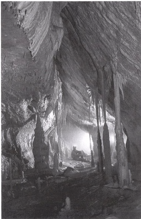
Epuran-barlang (Mehádia)