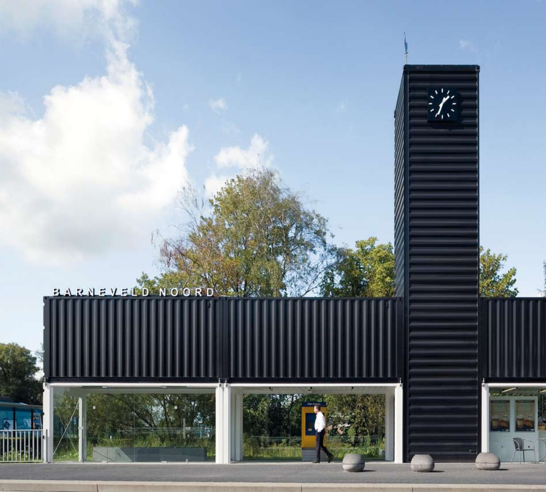
A valószerűtlenül lebegő tömegek hatására az állomás tárgyszerűvé válik

Ekként válhat a szállítványozási konténe- rekből felépült, ideiglenes, külvárosi vasúti megálló végéje ünnepélyes, 12 méter magas, felülvilágított szentélyé és lesz a végtelenség ig leegyszerűsített épület szerethető, különö- sen a tornyára biggyesztett szélcsirke miatt. Nem szélkakas, ugyanis Barneveld Hollan- dia tojás-fővárosa és egyébként is az állomás magyarra fordítva a Csirke úton (Chicken Line) áll. A holland vasúthálózatért felelős ProRail által életre hívott Prettig Wachten, avagy kezdeményezés a „kellemes várako- zásért”, húsz, többnyire kis alapterületű vas- útállomás újragondolását célozta meg azzal a szándékkal, hogy azokat az utasok szá-