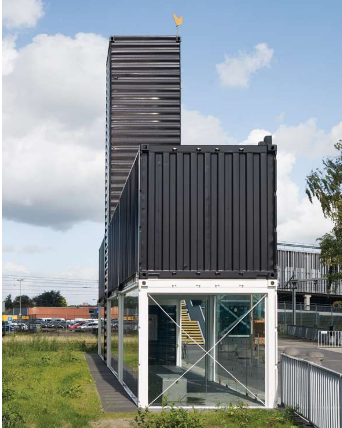
Erőlködésmentes funkcionalitás és profán illeszkedés