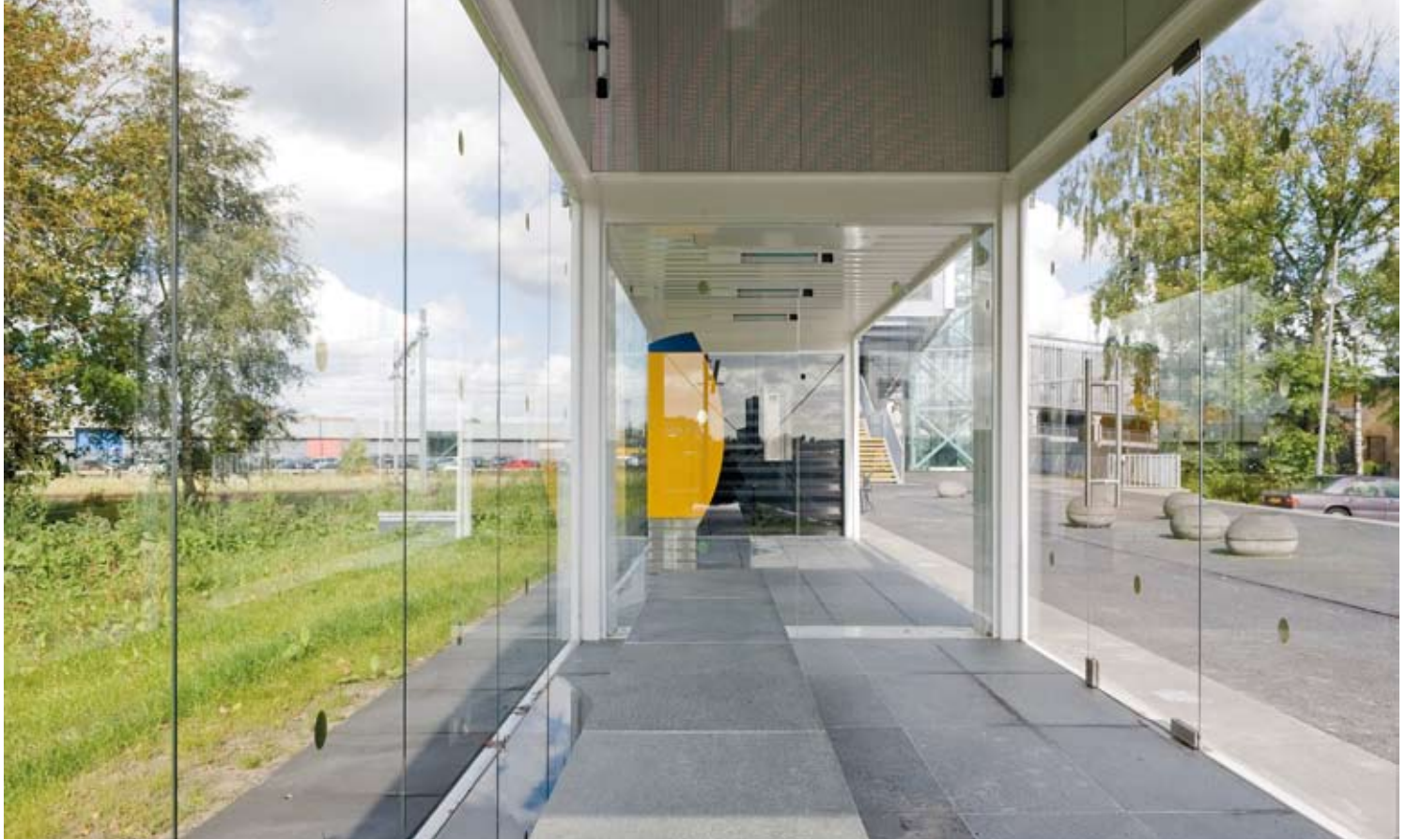
A külső és belső tér szinte megszakítás nélkül kapcsolódik egymásba

logikusan felépített gigantikus építészeti koncepciónál, mint amennyitől egy épület egyszerűen csak működőképpé válik. Nincs tehát titok itt, egyszerűen az alapvető emberi igények figyelembevételére történt. Más különben ezek ugyanazok a karcos, németalföldi megoldások, amelyeket az elmúlt évtizedekben oly sokszor láttunk már, amelyeket a liberális holland közönség oly rendületlenül tolerál