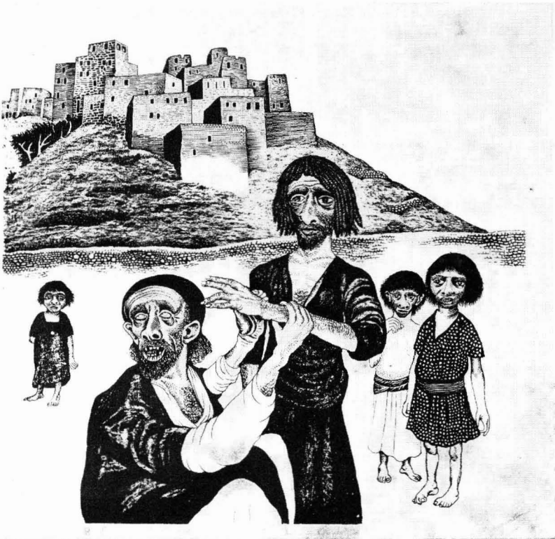
Somogyi Győző munkái