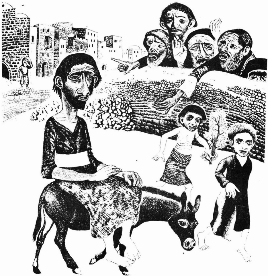
Somogyi Győző: Bevonulás Jeruzsálembe